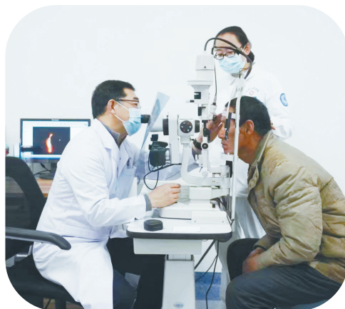
为群众提供优质医疗服务