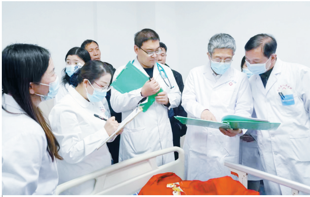
为患者提出合理诊疗意见

一面锦旗的背后承载的是家属对医护人员工作的肯定,更是激励他们努力前行的动力。和济医院儿科将始终秉承“守护生命摇篮、托起明天太阳”的科训,继续以精湛的医疗技术、优质的护理服务为每一位新生儿的健康成长保驾护航。