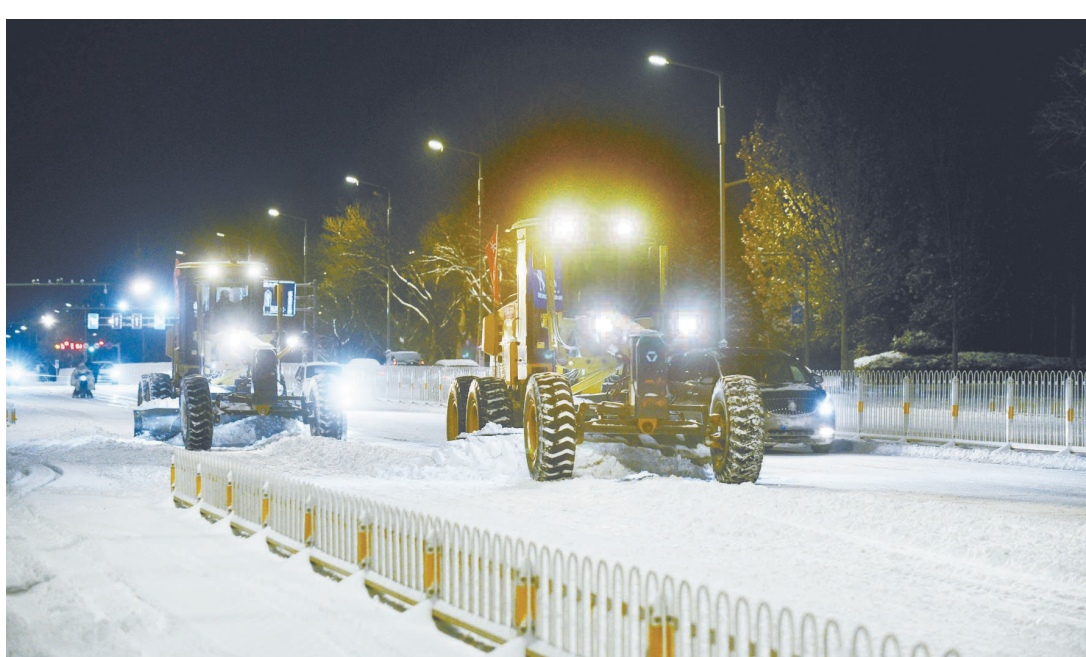
12月11日，根据天气变化情况，我市各部门积极响应，不断强化措施，加大力度，及时做好道路桥梁除雪融冰防滑工作，为市民群众提供一个良好的出行环境。

街、解放东西街进行机械除雪，确保道路畅通。市市政部门相关人员表示，进入冬季，将持续关注气象预报，在确保我市公共设施安全运营的同时，尽最大努力为市民提供良好的出行环境。