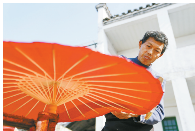
江西省婺源县赋春镇甲路村的工匠为甲路纸伞上桐油(1月11日摄)。江西婺源甲路纸伞已有800多年的历史，以竹为骨，以纸为面，选材讲究，工艺精细。制作甲路纸伞需要绕伞圈、裱伞、绘画、上桐油、结顶等七十多道工序。