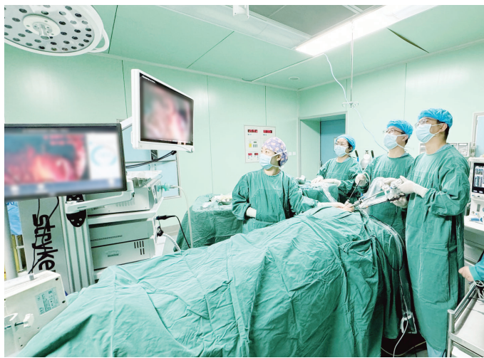
普外科医护人员为患者实施经颌下腔镜甲状腺癌根治术。

经颌下腔镜甲状腺癌根治术的开展是市中医院普外科治疗理念的创新,更为患者在保证手术质量、治愈疾病、功能保护的前提下,实现微创、美观的效