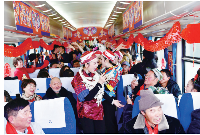
1月26日，在5640次列车上，少数民族演员在演唱《铁路修到苗家寨》。 往返于贵阳与玉屏之间的5640/39次绿皮火车，开行至今二十多年，为沿途10多个小站附近的村民提供了便捷快捷的出行方式，是乡亲们走亲访友的“幸福快车”，更是把大山里的农特产品送到山外售卖的“致富快车”。