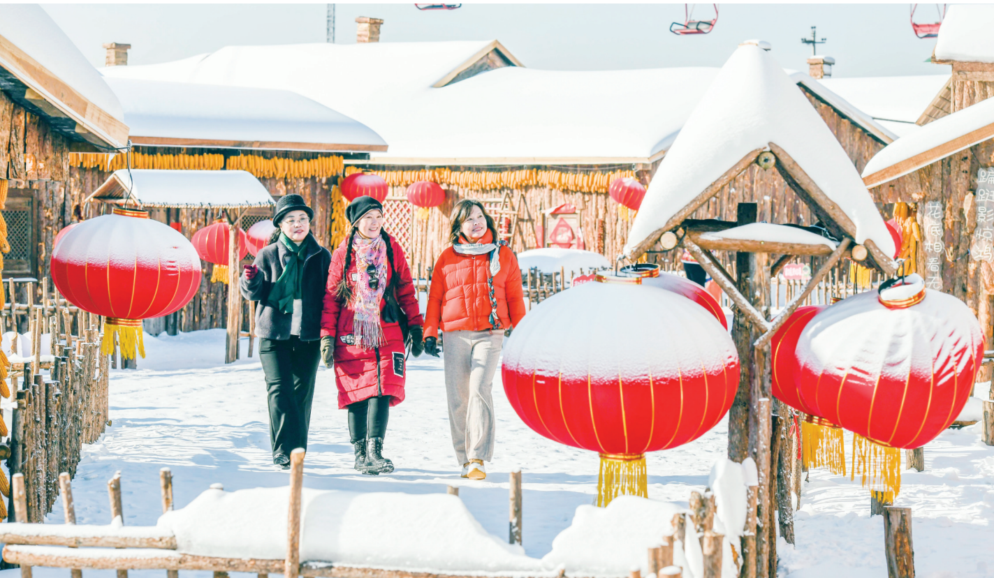
1月27日，游客在河北省遵化市山里各庄的山庄雪乡景区游玩。 冬日里，河北省遵化市团瓢庄镇山里各庄村积极开发冰雪旅游项目，打造冬季美丽乡村，吸引游客前来参观游玩，走出一条冬季特色乡村旅游之路。

活动现场，来自北京、太原、昆明铁路局集团公司的铁路职工表演了文艺节目，向参与“温馨春运、文明出行”签名打卡活动的旅客赠送了“铁路悦读好书榜”推荐的重点图书和春联“福”字，黑龙江省文明办负责人、各地志愿者和旅客以视频形式畅谈工作打算和体会感受。在北京丰台站候车的许多旅客驻足观看启动仪式，并表示要在旅途中讲文明、树新风，做文明公民。