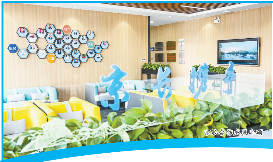
京长合作成果丰硕