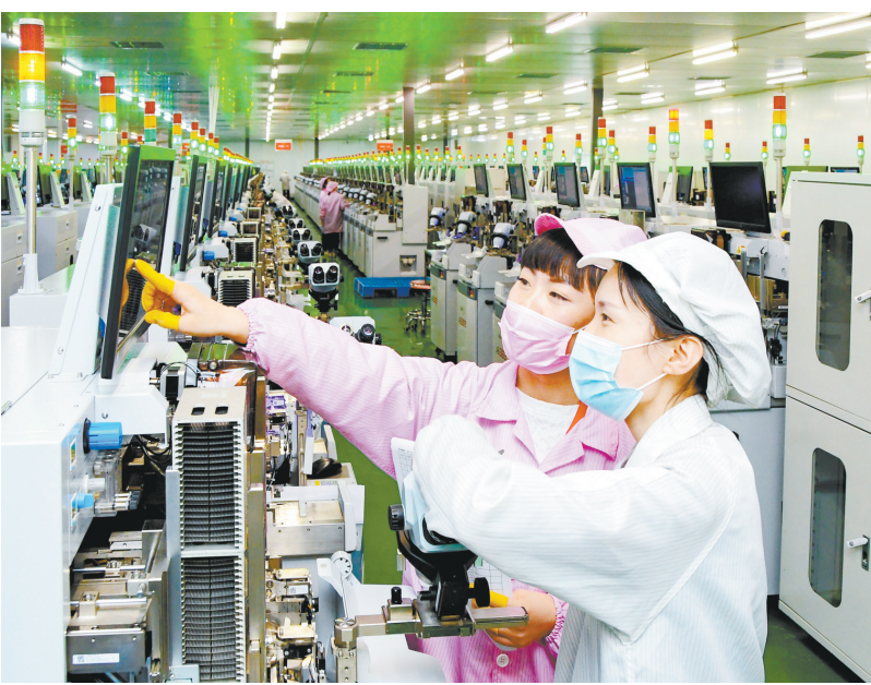
人才引进赋能发展