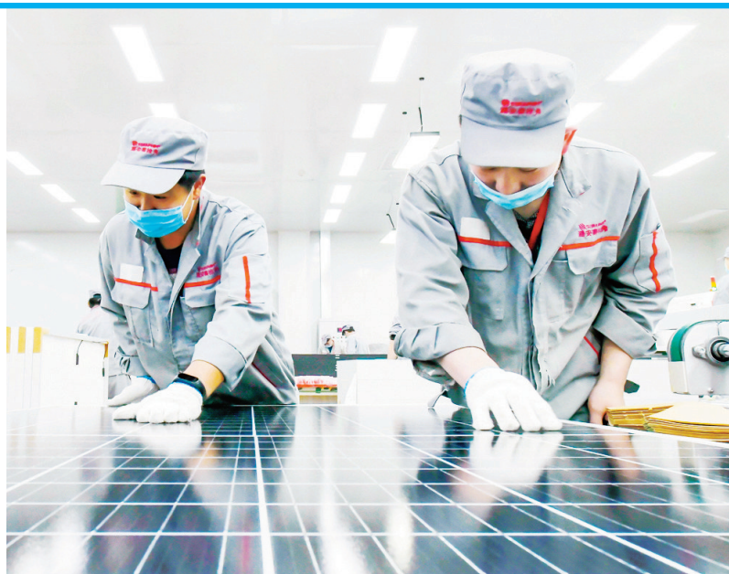
科技创新产业焕新