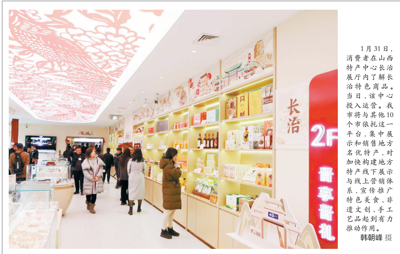
1月31日,消费者在山西特产中心长治展厅内了解长治特色商品。当日,该中心投入运营。我市将与其他10个市依托这一平台,集中展示和销售地方名优特产,对加快构建地方特产线上线下展示与线上营销体系,宣传推广特色美食、非遗文创、手工艺品起到有力推动作用。