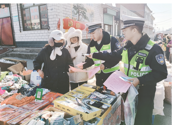
为全力做好春运期间交通安全宣传工作，连日来，沁县公安局交警大队民警深入辖区，向群众发放交通安全资料，讲解交通安全法规，进一步提升群众交通安全意识。

随后，秦书伟来到市公安局上党分局交警大队，认真听取智慧交通工作情况汇报，系统分析辖区重点路段交通安全隐患，研究制定整改措施。他强调，要加强交通秩序管理，针对酒驾、逆行、乱停乱放等突出交通违法行为，强化路面管控，加大执法力度，全面优化道路交通环境。要抓好重点路段道路提标工作，结合辖区交通实际，持续强化道路安全防护设施设置，配齐交通信号灯、减速带、路侧护栏等设施，努力从源头预防和减少风险隐患，全力保障人民群众出行安全。