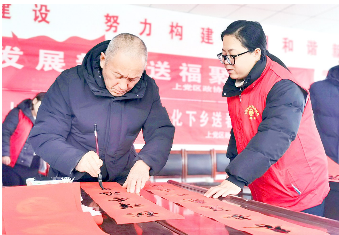
2月1日，上党区政协联合文联、书画协会和部分政协委员，在郝家庄镇郝家庄村开展“迎新春、送春联”活动。俊逸的书法、真挚的祝福，寄托了辞旧迎新、接福纳祥的美好愿望。领到春联的群众笑意盈盈，喜悦之情溢于言表。

“我们要主动作为、提早谋划、扛牢责任，以时不我待的争先气势为我市乡村振兴高质量发展提供坚强的自然资源工作保障。”市规划和自然资源局党组书记、局长谢斌表示，全系统将进一步强化国土空间规划管控，把新一轮耕地和永久基本农田保护任务套图下达各县区，全面压实耕地保护党政同责。全面推进“田长制”，设立市、县、乡、村四级田长，实现耕地和永久基本农田保护责任全覆盖。严格耕地用途管制，落实耕地占补平衡，拓宽补充耕地来源。实行永久基本农田特殊保护，从严管控非农建设占用永久基本农田。按照“应编尽编”原则，全面完成2024年村庄规划编制任务。扎实开展建设用地保障提速增效行动。牢固树立和践行“绿水青山就是金山银山”理