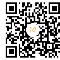
扫一扫 看《长治日报》视频号更精彩