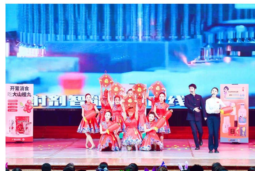
电商公司表演情景剧《筑梦电商人》