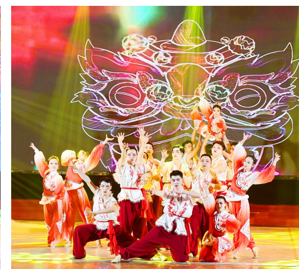
营销上海班表演舞蹈《东方雅韵》