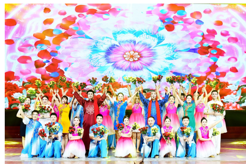
集团总部进行情景说唱《新十年，从新出发》