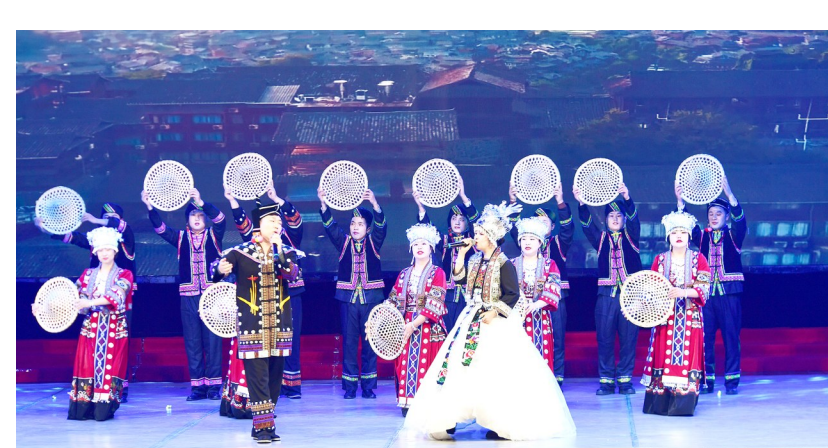
营销贵州班、安徽班、四川班表演舞蹈《星动九州》