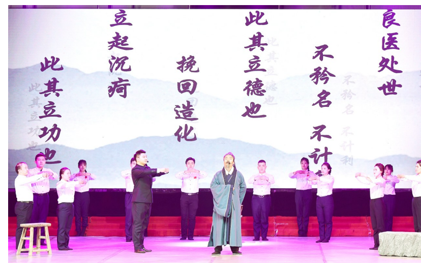
屯留五和堂公司员工表演情景剧《匠心筑梦·振东中药情》