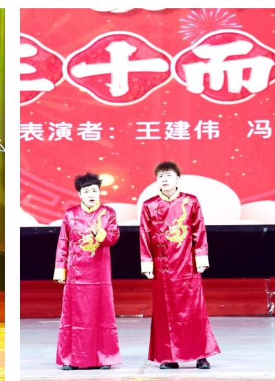
大同泰盛制药表演相声《三十而励》