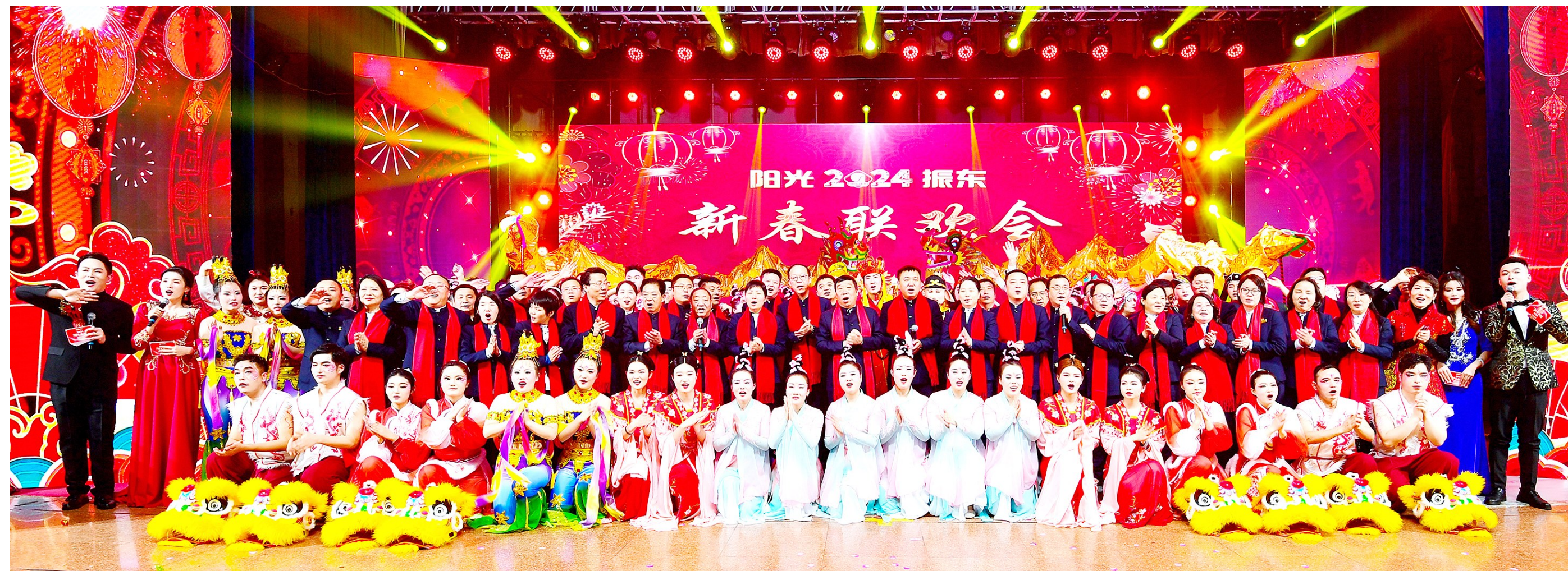
大合唱《祖国不会忘记》

一年春作首，万事行为先。人勤春早，龙年的年味依旧浓烈，春天的气息已经扑面而来。新春伊始，山西振东健康产业集团以龙腾虎跃、鱼跃龙门的干劲闯劲，振奋龙马精神，吹响奋进的号角，迈开奋斗的征程。