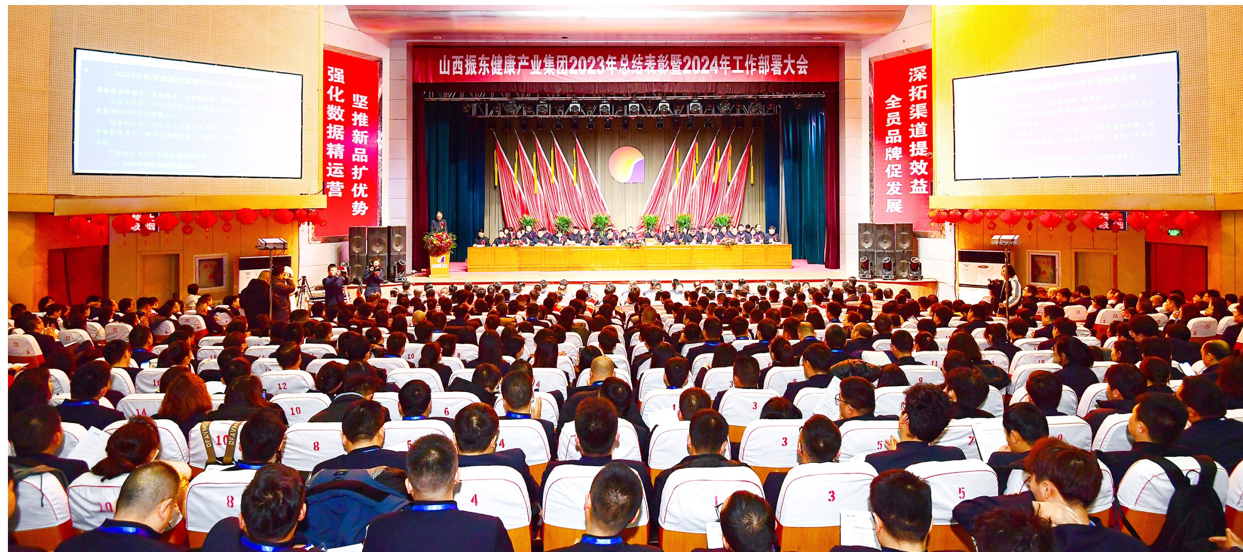
山西振东健康产业集团2023年总结表彰暨2024年工作部署大会