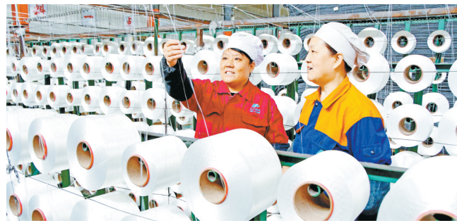
襄垣县山力铂纳橡胶机带有限公司开足马力抓生产