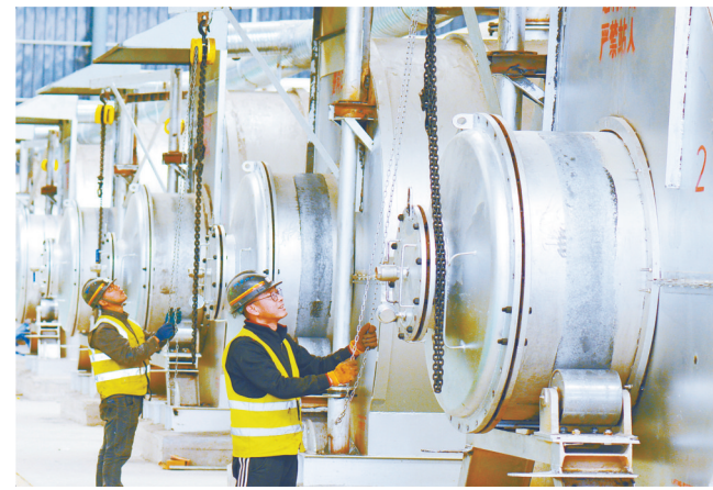
襄垣县聚和鑫再生资源轮胎热裂解车间调试设备保安全