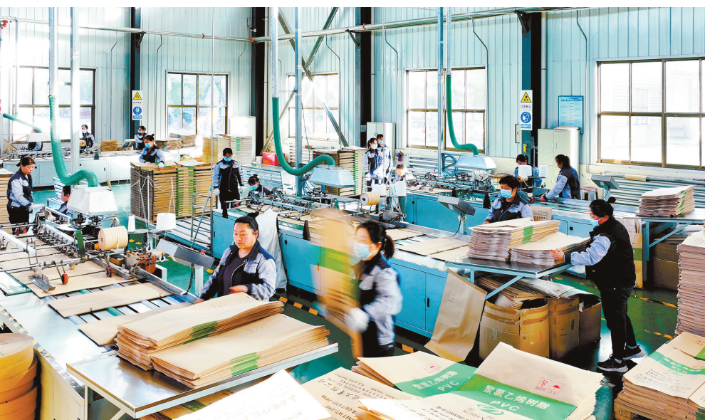
山西丰诺包装有限公司吹响复工“集结号”

策划/本报记者 王娅宁 文字/本报记者 徐 姗 通讯员 崔 晶 版式/本报记者 马学勤