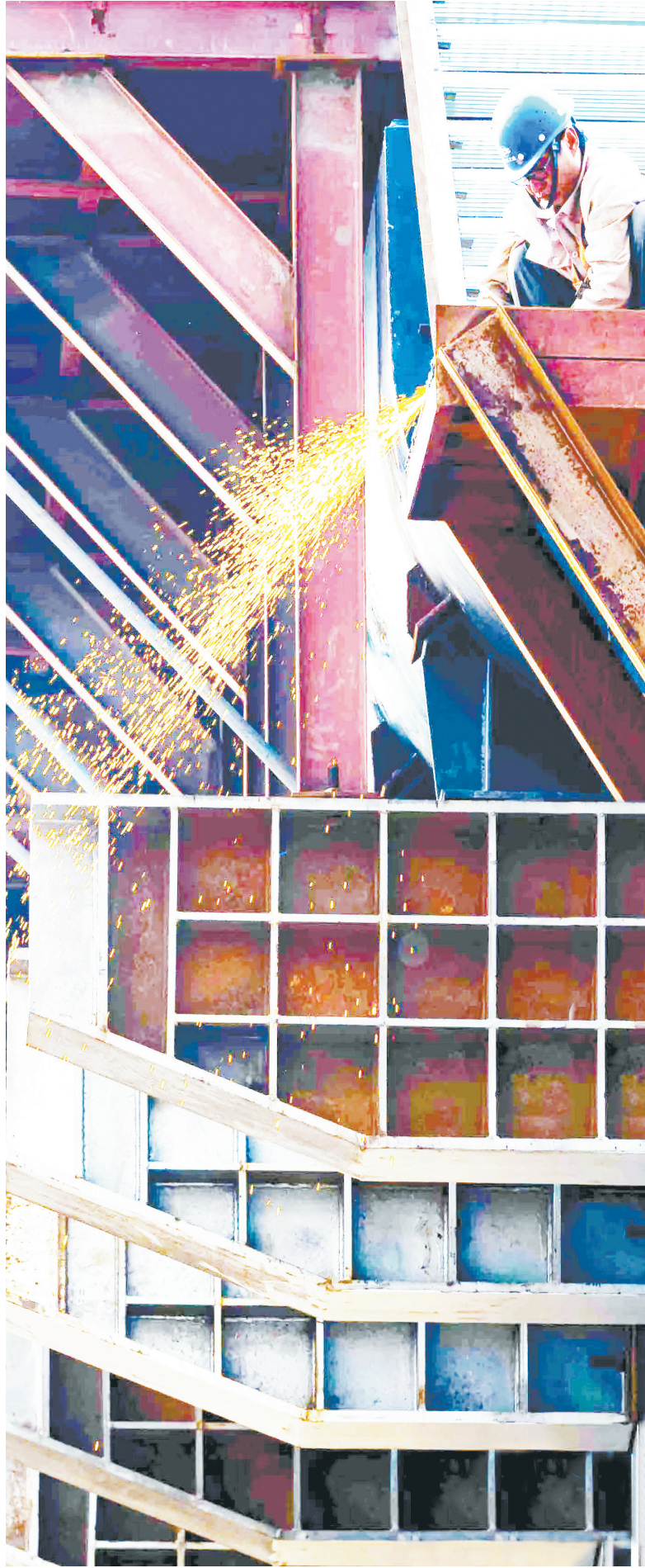
山西金辉焦化有限公司项目建设热火朝天