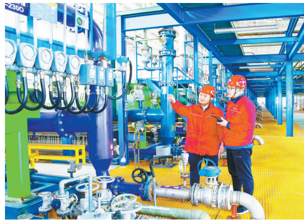
山西瑞恒化工有限公司复工达产蹄疾步稳