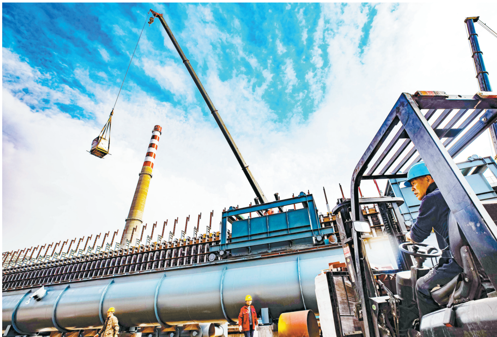
山西华星生态科技有限公司铆足干劲抓生产