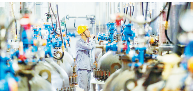
襄垣县裕英永水处理材料有限公司全力以赴促发展