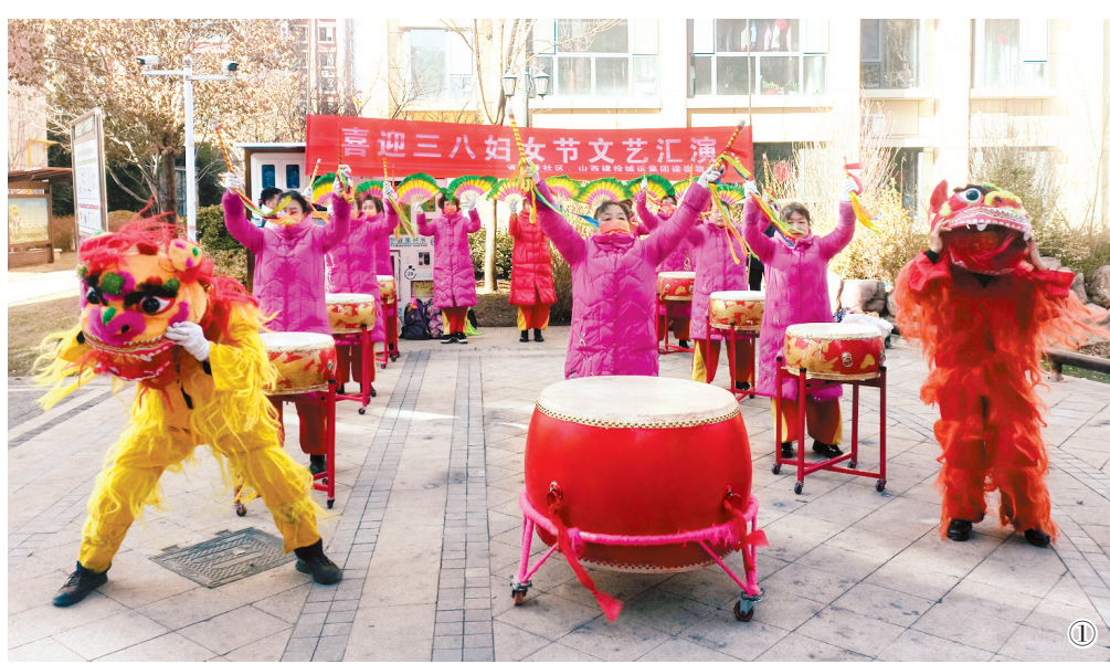
图①：3月7日，潞州区太西街道省建巷社区举行妇女节文艺汇演，丰富社区居民文化生活。