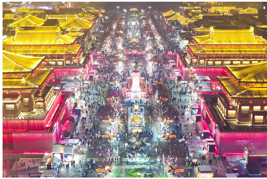
这是2024年2月2日拍摄的西安大唐不夜城景色(无人机照片)。