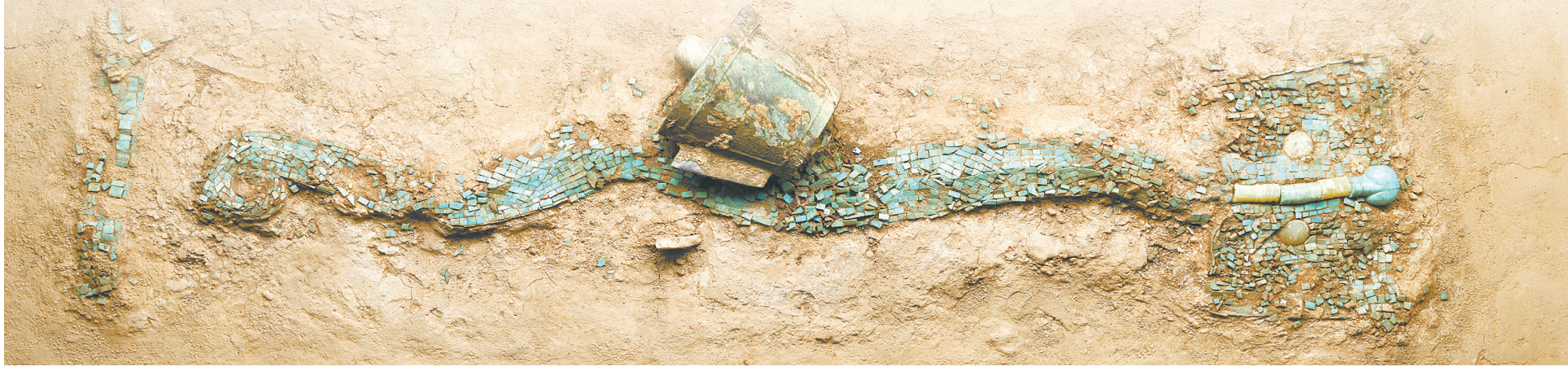
现藏于中国考古博物馆的绿松石龙形器(2024年1月29日摄)。