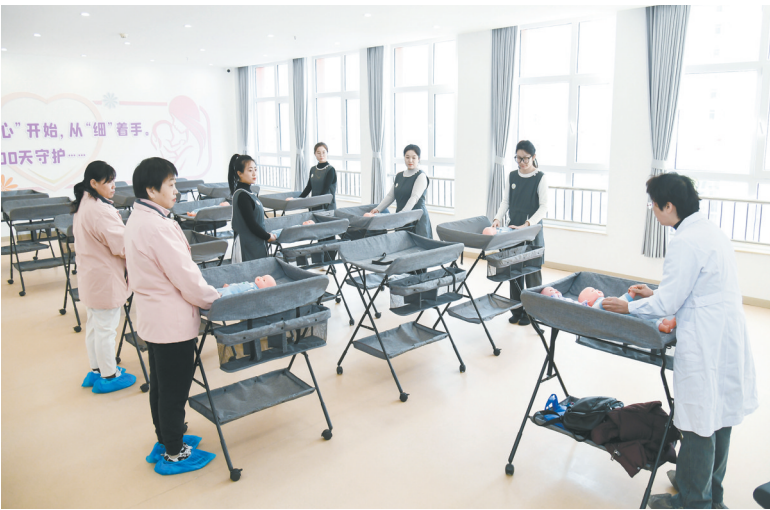
省级托育产教融合实训基地培训现场