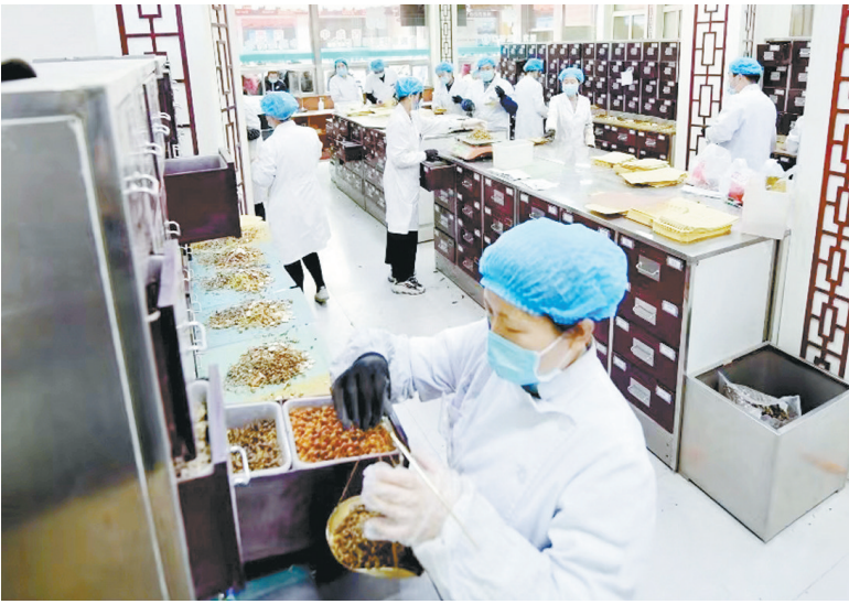
市中研附院传承中医文化、惠及百姓健康