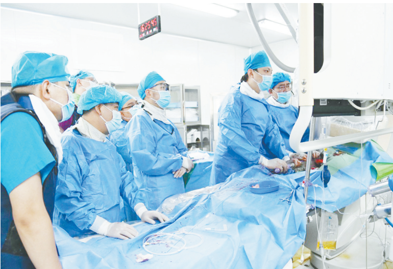
市人民医院推进省级区域医疗中心建设