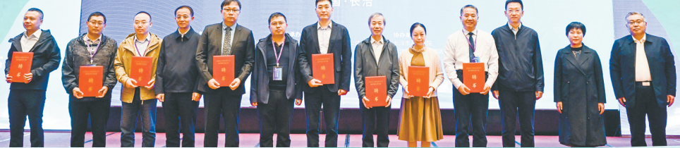
长治市柔性引才推进中医药发展传承创新