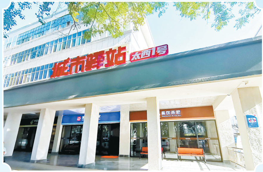
城市驿站——城市户外工作者的休憩港湾