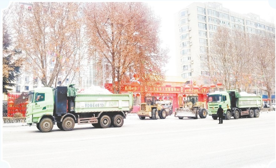
以雪为令，保畅保通