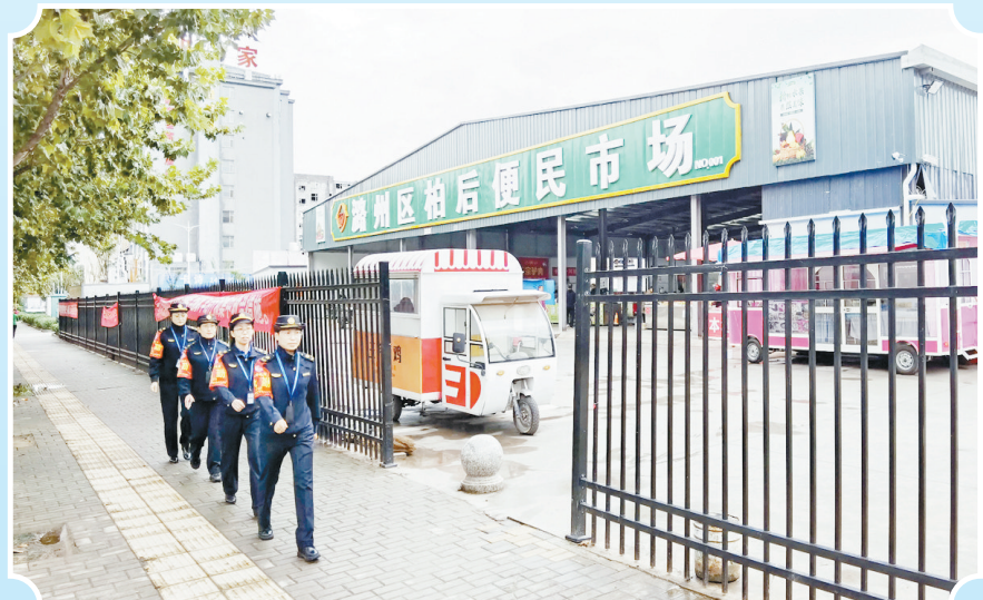
执法队员加强便民市场周边区域巡逻

精细化管理提供了“智慧引擎”，让城市发展更智慧。打造“长治城管”微信小程序，有效拓展市民群众参与城市管理的渠道路径，让群众反映问题更便捷、解决渠道更畅通，查看结果更直接，充分调动市民参与城市管理的积极性主动性，奏响城市共建共治共享“大合唱”。我市作为全省第一批与国家城市综合管理服务平台对接联网的城市，确立了建设一个市级监督指挥中心，采取“以市带县”的形式，打造形成覆盖全市四区八县一高新区城市群的数字网络城管体系，有效形成了“人民城市人民建，人民城市为人民”良性互动循环，不断增强群众的获得感、幸福感。 风正好扬帆，奋斗正当时。站在新征程起点，市城市管理局将始终秉承“为人民管好城市”的工作理念，紧紧围绕群众所急所想所盼，解放思想、开拓创新，脚踏实地、埋头苦干，把市委、市政府谋划的发展蓝图、作出的战略部署转化为工作的作战图、施工图、实景图，以新的气象、新的作为、新的业绩交出一份满意的答卷。