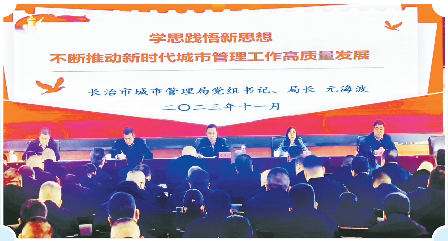
系统内党员干部教育培训