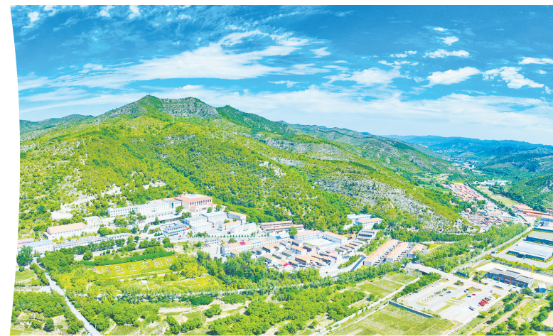
学习运用“千万工程”经验催生和美乡村