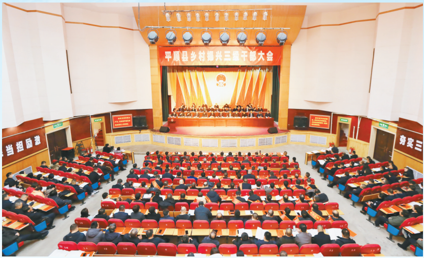
平顺县乡村振兴三级干部大会