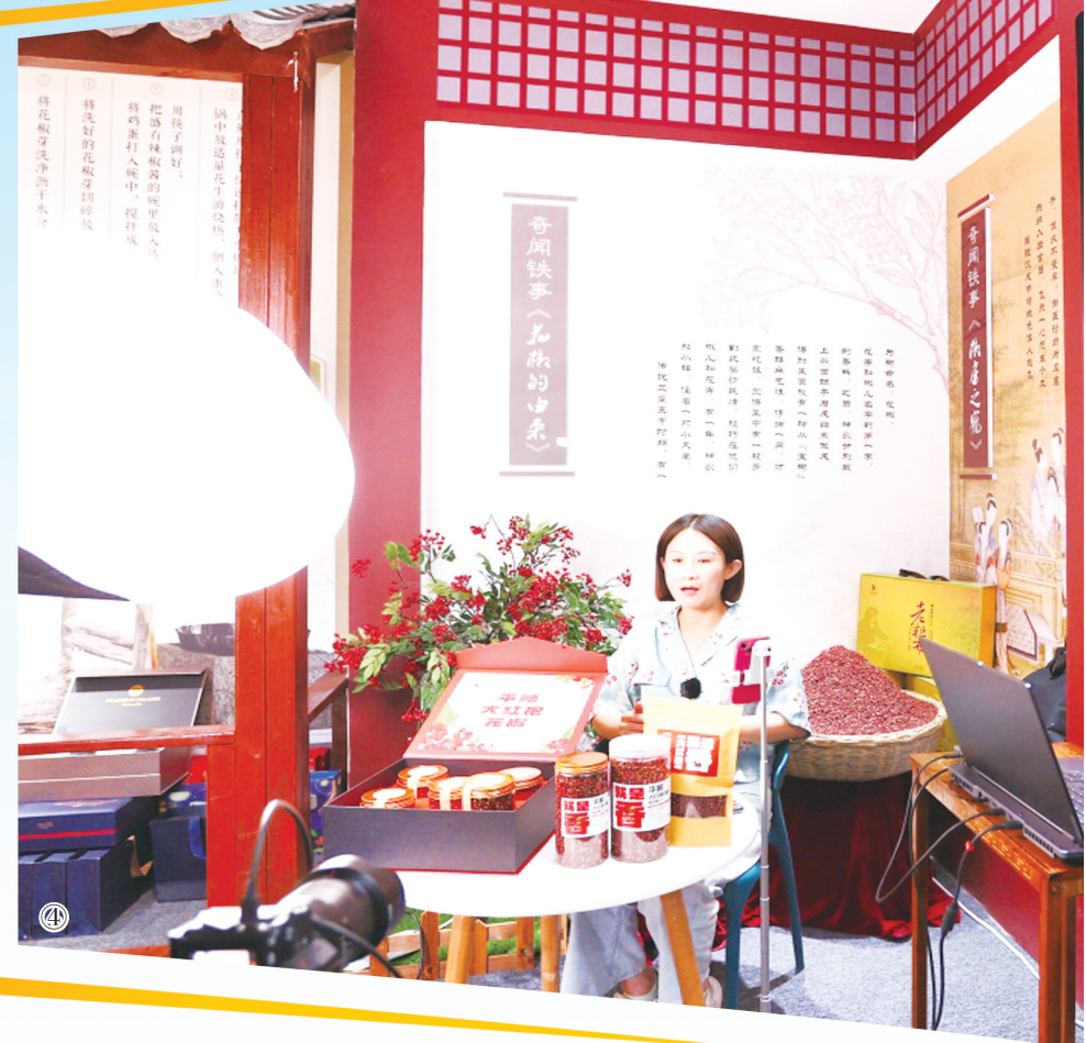
龙镇村药农产业融合发展展示园