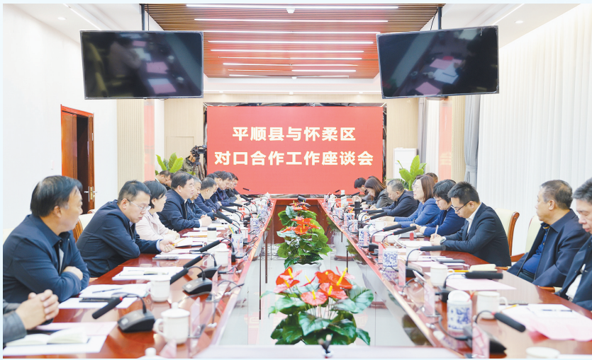
与北京市怀柔区开展对口合作成果丰硕