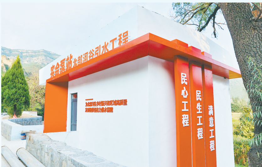
151个行政村集中供水实现全覆盖