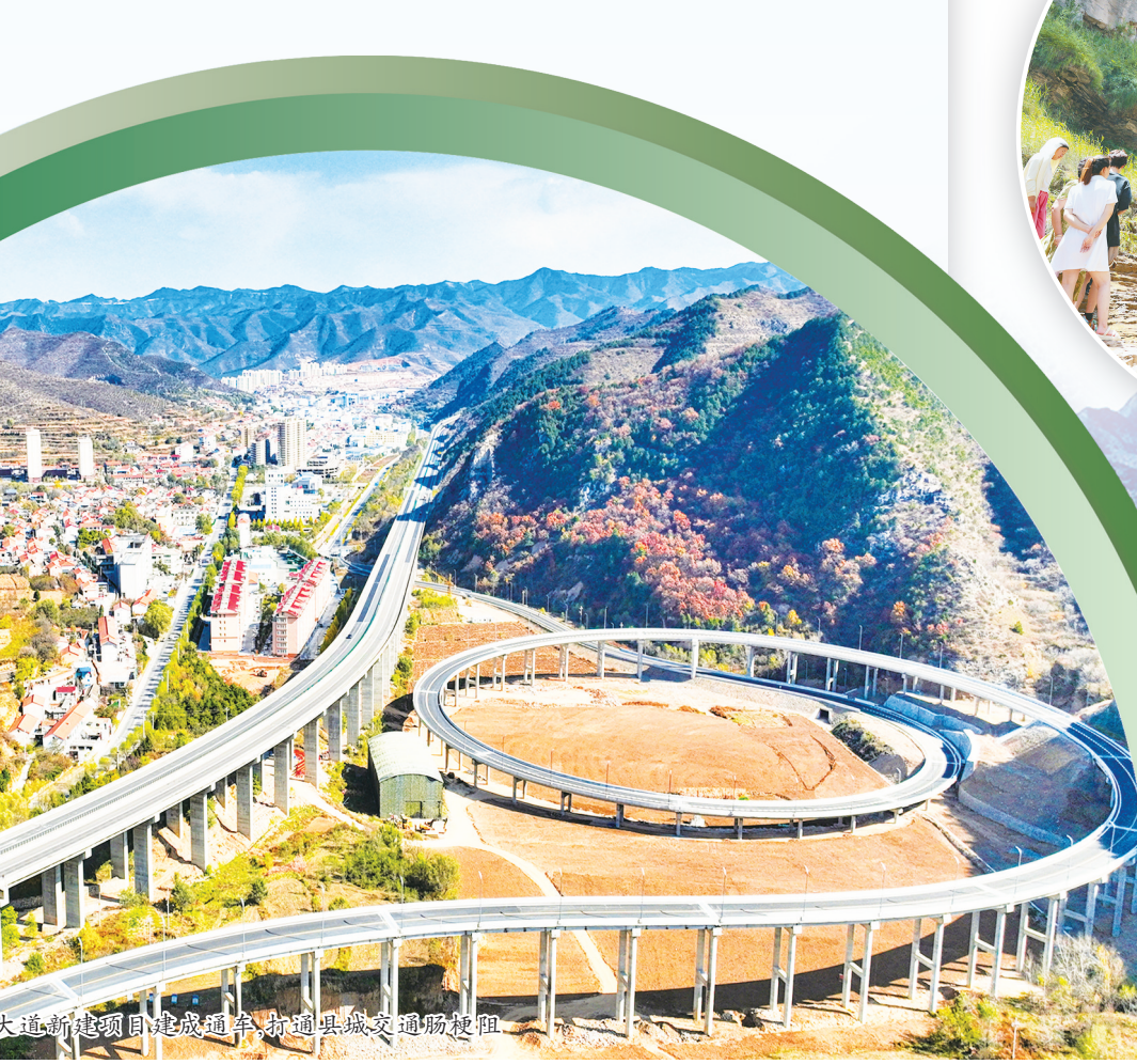
彩凤大道新建成路段，车辆行驶顺畅