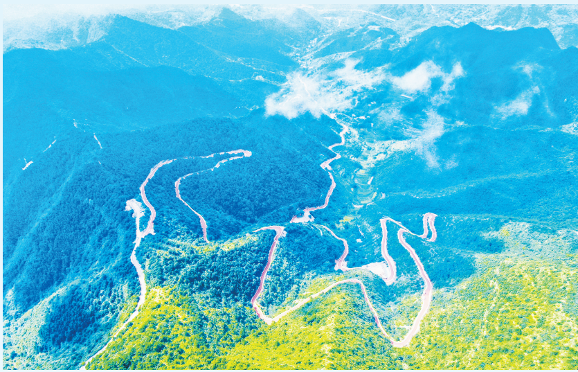
大交通建设助力全面发展