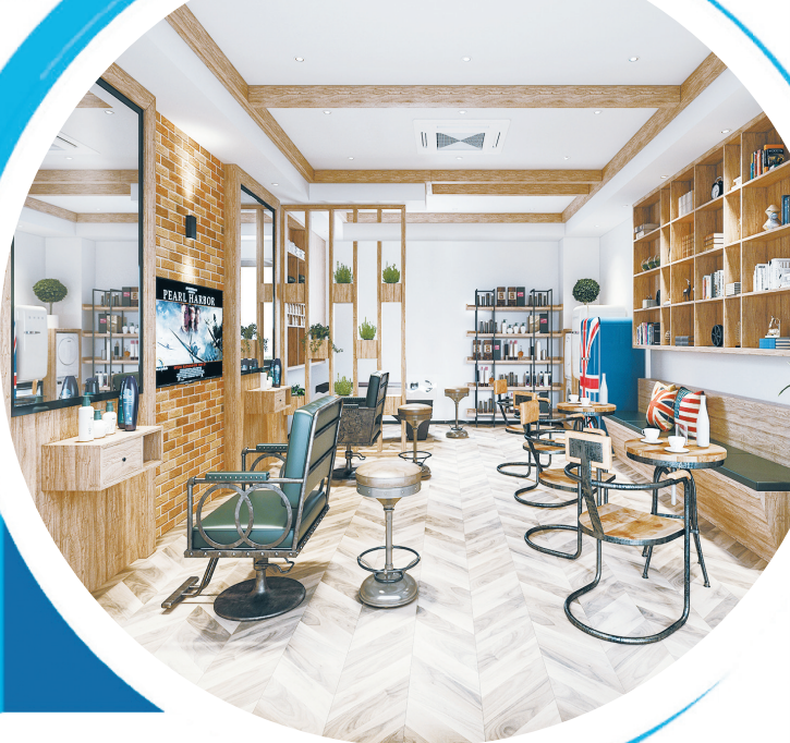
就业创业实训基地效果图