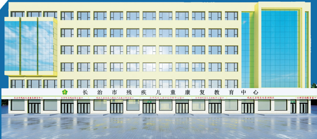
长治市残疾儿童康复教育中心效果图