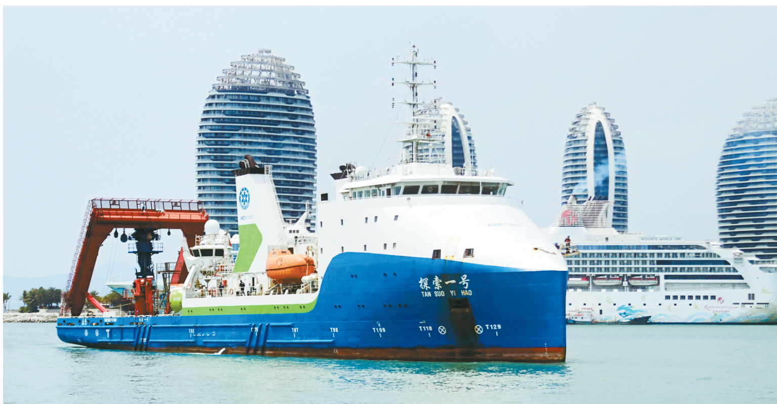
“探索一号”科考船搭载“奋斗者”号全海深载人潜水器返回海南三亚(2024年3月28日摄)。此次科考历时50天,顺利完成中国—印度尼西亚爪哇海沟联合深潜任务。

“所当乘者势也,不可失者时也。”我国用几十年的时间走完了西方发达国家几百年走过的工业化历程,建成全球最完整、规模最大的工业体系,进入创新型国家的行列,生产力和科技创新能力大幅提升,为发展新质生产力奠定坚实基础。踏上新征程,扭住创新“牛鼻子”,厚植发展“绿色底色”,下好改革“先手棋”,打造人才“强引擎”,我们就能不断开辟新赛道、增强新动能、塑造新优势、拓展新空间,推动高质量发展不断迈上新台阶。