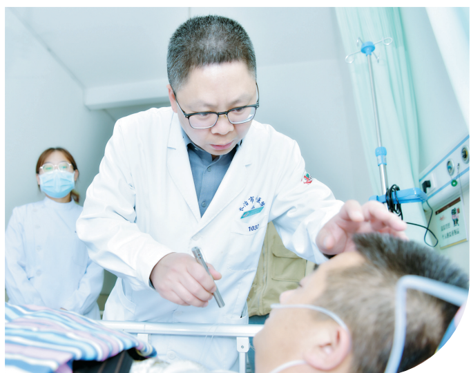
对待患者耐心细心