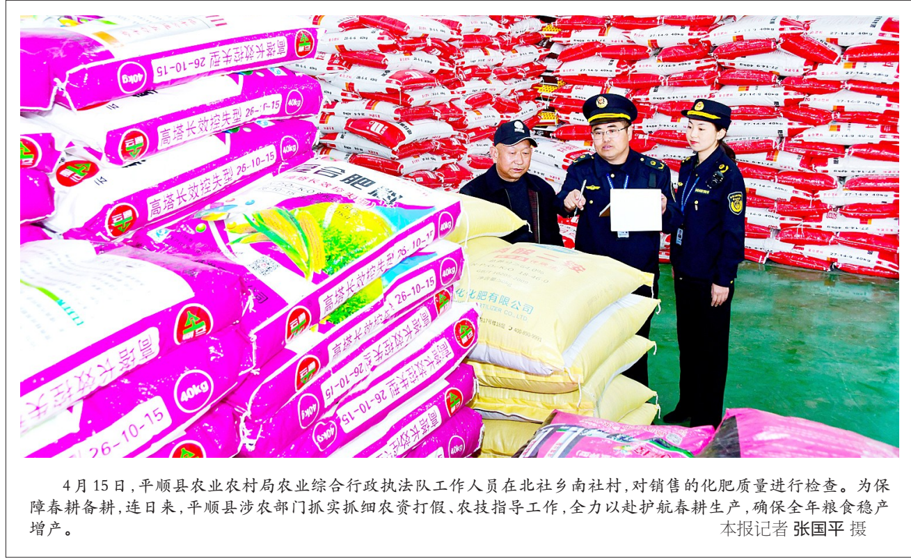
4月15日，平顺县农业农村局农业综合行政执法队工作人员在北社乡南社村，对销售的化肥质量进行检查。为保障春耕备耕，连日来，平顺县涉农部门抓实抓细农资打假、农技指导工作，全力以赴护航春耕生产，确保全年粮食稳产增产。