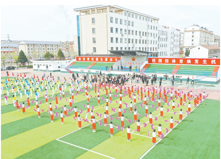
4月14日，武乡县太行小学开展阳光体育展示活动。近年来，该校充分调动学生积极性，创新符合学生性格特点、兴趣爱好的体育运动形式，实现阳光体育多元发展。

（上接第一版）在2023年度党报党刊征订工作中，长治日报社严密部署，紧抓落实，进一步完善相关制度，在重点抓好大户征订的同时，积极做好零散户和自费订户的征订，采取电话预约、上门服务、线上线下征订相结合的方式开展征订工作，确保巩固老订户、增加新订户。在全市各级各部门和广大读者的大力支持下，长治日报社按时保质完成2023年度党报征订工作，被协会评为2023年度全国报纸自办发行先进集体。