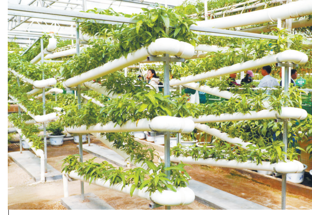
4月21日，在第二十五届中国(寿光)国际蔬菜科技博览会上展出的无土栽培温室。

“水利项目开工数量多、吸纳就业能力强，大规模水利建设直接提供了大量就业岗位。一季度，水利项目施工吸纳就业73万人，比去年同期增长3.8%。”陈敏说。