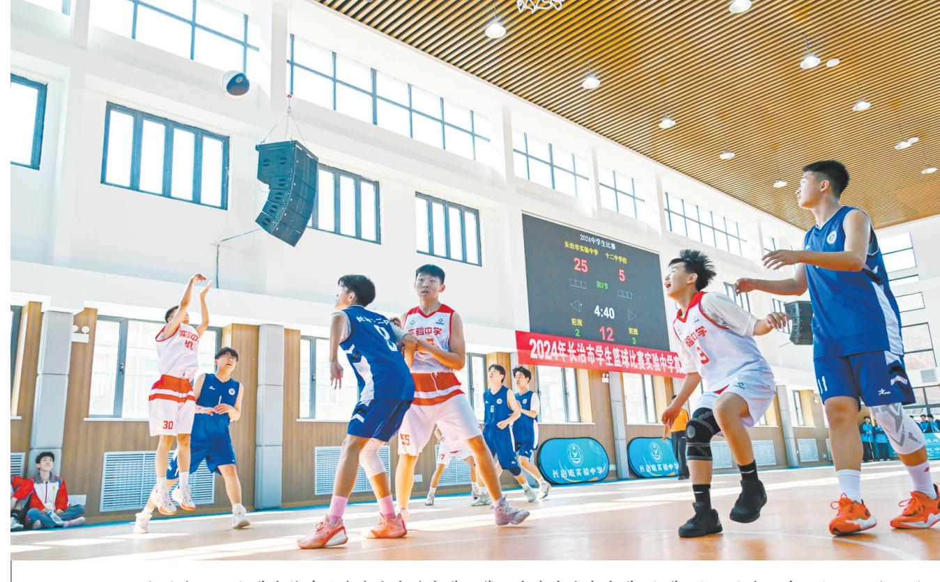
5月7日,长治市2024年学生篮球比赛在市实验中学开幕。来自我市各中学、小学、幼儿园的82支队伍1400名运动健儿,将在为期一周的比赛中展开激烈角逐,尽情感受运动的魅力与快乐。

为更好运用“六查”工作法抓好现场安全,煤基合成油公司进一步规范“六查”工作流程,要求各生产车间每周要完成一次对照自检,通过对生产现场全面自查对照现场管理是否符合标准、制度,各项措施采取是否得当,再形成本部门的隐患自查清单,在跟踪整改后进行总结评价。在此基础上实施“两闭环”,即安全管理部门负责对现场存在问题、整改情况进行全面跟踪落实,抓好现场隐患整改追踪的“闭环”;对各车间分析情况、总结评价情况进行横向比较、推广学习,同步实现奖惩兑现的“闭环”。“六查两闭环”工作法的推广,使得管理举措更加合理,安全人员查规范、识风险、定措施的专业能力得到增强,企业安全生产管理水平进一步提升。(吴晓静 徐雅男)