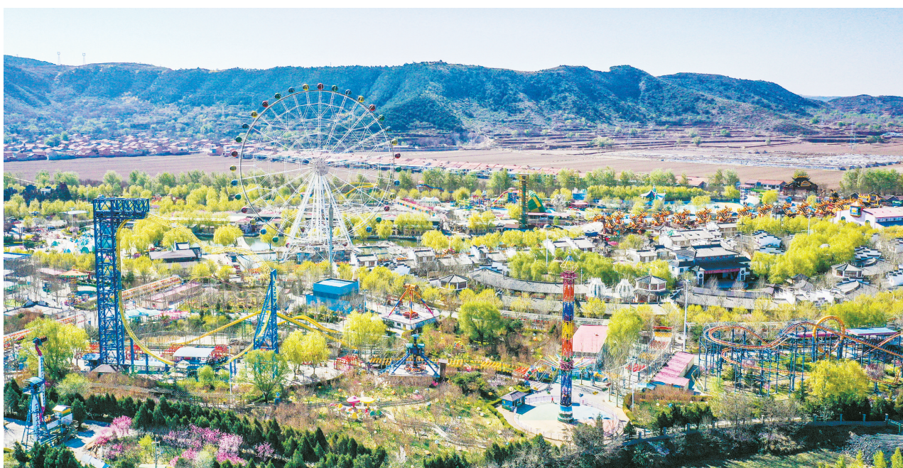
5月10日，航拍下的壶关县欢乐太行谷景区绚丽多姿。近年来，该景区不断加大硬件设施建设力度，全面优化服务保障，大力提升服务品质，满足游客多元化旅游需求。

移动互联网时代，手机已成为我们生活中的必需品。现实生活中，“低头族”无处不在。有的人吃饭看手机、睡前看、等人看、走路看，甚至开车时也喜欢看手机。如果说在公交站点等车时看手机无可厚非，那么过马路或开车骑车时，仍眼不离屏就存在极大的安全隐患。文明出行，拒绝做马路“低头族”。 马路“低头族”，就像公路上的一颗不定时的炸弹。为什么还有那么多人选择做马路“低头族”？究其原因，不外乎以下几种。其一，很多人存在侥幸心理，自认为“不会出什么大事”。其二，一些人存在手机依赖，习惯了随时接收和回复通讯消息。与此同时，除了意识问题和个人习惯外，快节奏的工作和生活也成为催生马路“低头族”的重要原因。有的人认为“刚下班，有点累，刷刷短视频放松一下”；有的外卖小哥和快递员不得不随时看手机，及时接单、回复客户信息。 不可否认，移动互联网给我们带来了极大的便利，然而过度看手机也带来了安全隐患，马路“低头族”导致人身伤亡的交通事故屡有发生。治理马路“低头族”，要疏堵结合、软硬兼施。一方面，要加大宣传力度，进行正确引导，制定倡议性的文明守则，唤起更多人的安全意识。另一方面，文明是管出来的。很多城市祭出重拳，开始尝试地方性立法，严格采取加强监管与处罚的方式进行整治。 道路千万条，安全第一条。我们过马路时拒绝做“低头族”，注意观察、安全通过；驾驶机动车、骑电动车时遵守交规，不接打电话、不看视频，必须看手机时要择时靠边停下，争做文明人，为自身和他人增添一份安全保障。