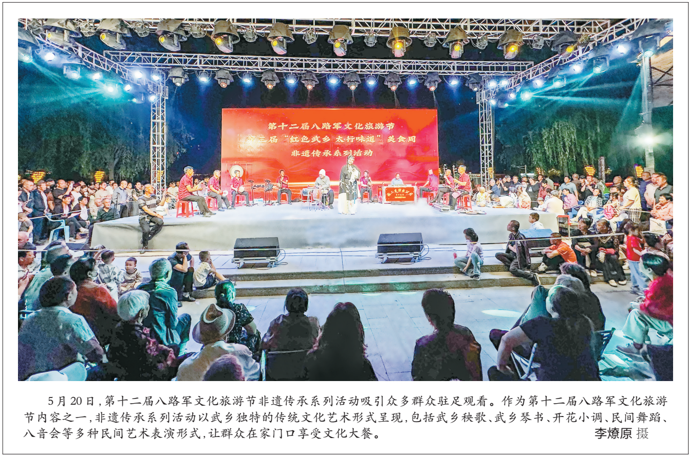
5月20日,第十二届八路军文化旅游节非遗传承系列活动吸引了众多群众驻足观看。作为第十二届八路军文化旅游节内容之一,非遗传承系列活动以武乡独特的传统文化艺术形式呈现,包括武乡秧歌、武乡琴书、开花小调、民间舞蹈、八音会等多种民间艺术表演形式,让群众在家门口享受文化大餐。

(上接第一版)此外,屯留经开区立足企业建设发展用电、用水、用气、供暖、交通、网络等基础设施要求,全力完善硬件设施建设。全力推行“地等项目”机制,做好土地收储,完成节能、地灾、压矿、水保、洪水、环境、地震、文物8项区域评价工作,为企业用地做好前期准备,仅办理用地手续这一项可为企业节省半年时间,以实际行动提升了经开区优化营商环境硬件承载能力,为企业入驻提供坚实基础。