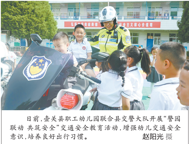
日前,壶关县职工幼儿园联合县交警大队开展“警园联动 共筑安全”交通安全教育活动,增强幼儿交通安全意识,培养良好出行习惯。

本报讯 记者王涵 通讯员李前锋报道:5月23日,市消防救援支队联合市场监管、住建、公安、综合执法等多个部门组成检查组,深入潞州区部分高层住宅小区、商业街区,电动自行车销售点,开展电动自行车消防安全隐患夜查专项整治行动,及时消除火灾隐患,全面提升辖区群众消防安全意识。 此次夜查行动,全市各级消防救援部门先后派出28个检查组、85名消防监督员深入全市各县区电动自行车停放充电场所开展夜查行动,对电动自行车是否违规停放充电,疏散通道和安全出口是否保持畅通,高层住宅是否存在“进楼入户”“飞线充电”等问题进行检查,累计检查场所207个。针对检查中发现的问题,检查组要求各场所立即整改,举一反三,全面排查消除火灾隐患。 夜查行动中,执法人员还耐心为群众讲解室内停放电动自行车存在的安全隐患,要求各小区根据业主需求,在人口居住集中区搭建停车棚、集中充电桩,切实解决居民电动自行车充电难题。同时,提醒居民及时关闭电动车自行车电源,清理充电区域内易燃杂物,严禁超负荷用电,从源头杜绝火灾隐患。