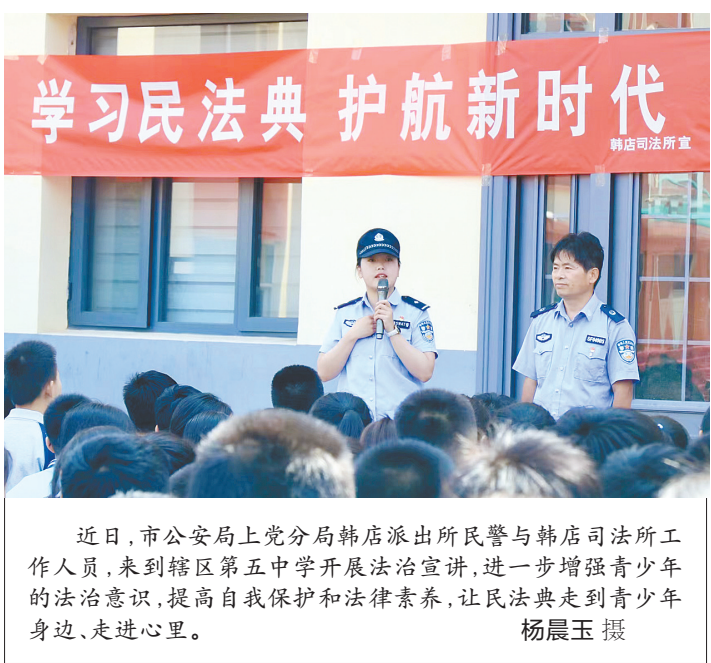
近日,市公安局上党分局韩店派出所民警与韩店司法所工作人员,来到辖区第五中学开展法治宣讲,进一步增强青少年的法治意识,提高自我保护和法律素养,让民法典走到青少年身边、走进心里。

(上接第一版)各级领导干部决不能安于现状、贪图安逸、松劲泄气,必须勇担重担,敢打硬仗,敢啃硬骨头,时刻保持“功成不必在我,功成一定有我”的胸襟,为长治经济社会发展担当努力。 以项目之进支撑发展之稳,必须导向鲜明,严格考核。各级领导干部要知责担责,将目光聚焦项目落地见效。要调频对表,倒排工期、挂图作战,坚决防止“开工不动工”“落地不落实”,切实做到真落地、真开工、真推进、真见效。要以时间倒逼任务落实,加强督查考核与问责,建立健全项目建设包干负责制度,用铁的纪律推动工作有效落实,确保全年目标任务顺利完成。 “长风破浪会有时,直挂云帆济沧海。”山再高,往上攀,总能登顶;路再长,走下去,定能到达。让我们满怀信心、坚定信念,苦干实干、团结奋斗,用今天的努力锻造长治未来的好成色。