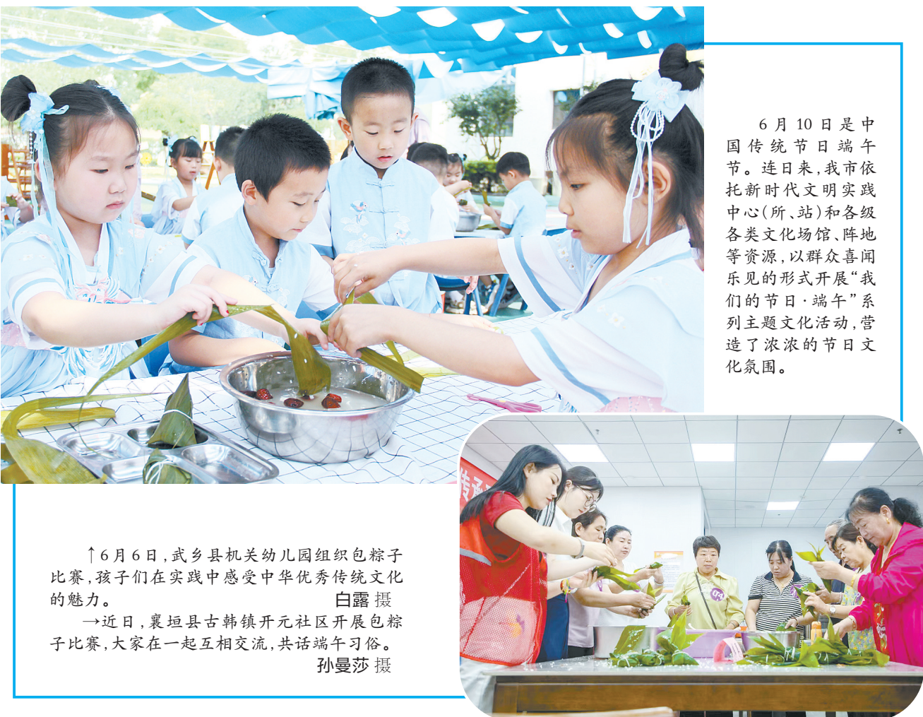
↑6月6日,武乡县机关幼儿园组织包粽子比赛,孩子们在实践中感受中华优秀传统文化的魅力。 →近日,襄垣县古韩镇开元社区开展包粽子比赛,大家在一起互相交流,共话端午习俗。

乐叶 端午时节,万物皆盛。追思为国为民的先贤,涵养家国情怀,历来是端午节的鲜明主题。爱国诗人屈原,因其人格高洁,成为端午节中华儿女普遍的精神追寻。包粽子、划龙舟、挂艾草……新时代、新征程,我们更应在丰富的节日活动中,弘扬端午文化,厚植家国情怀,争做爱岗敬业、对党忠诚、堪当民族复兴重任的时代新人。 弘扬端午文化,涵养爱国情。“诚既勇兮今又以武,终刚强兮不可凌”。两千多年前,屈原以自己宝贵的生命谱写了一曲壮丽的爱国主义乐章,他的感人事迹一直激励着一代又一代中华儿女。爱国,是人间最深沉、最持久的情感。我们要时刻把祖国的利益放在第一位,把自己的理想同祖国的前途、把自己的人生同民族的命运紧密联系在一起。要关注国家为我们做了些什么,更要多问问自己为国家能做什么、做了些什么。要增强民族自信心、自豪感、荣誉感,让爱国主义成为自己的坚定信念和精神依靠。 弘扬端午文化,践行报国志。“路漫漫其修远兮,吾将上下而求索。”屈原是这么说的,更是这么做的。道虽迩,不行不至;事虽小,不为不成。作为一个公民,干好本职工作,把爱国之心化为报国之行,就是爱国的具体行动,就是对屈原的最好纪念。之于工人而言,爱岗敬业,多生产合格工业产品就是爱国;之于农民而言,多打粮食,产好粮食,辛勤耕耘,为端牢中国饭碗尽绵薄之力就是爱国……愿每个公民都能承担起自己的“国家责任”,主动为国家分担忧愁,如此,中国梦的宏阔愿景才会得以实现。