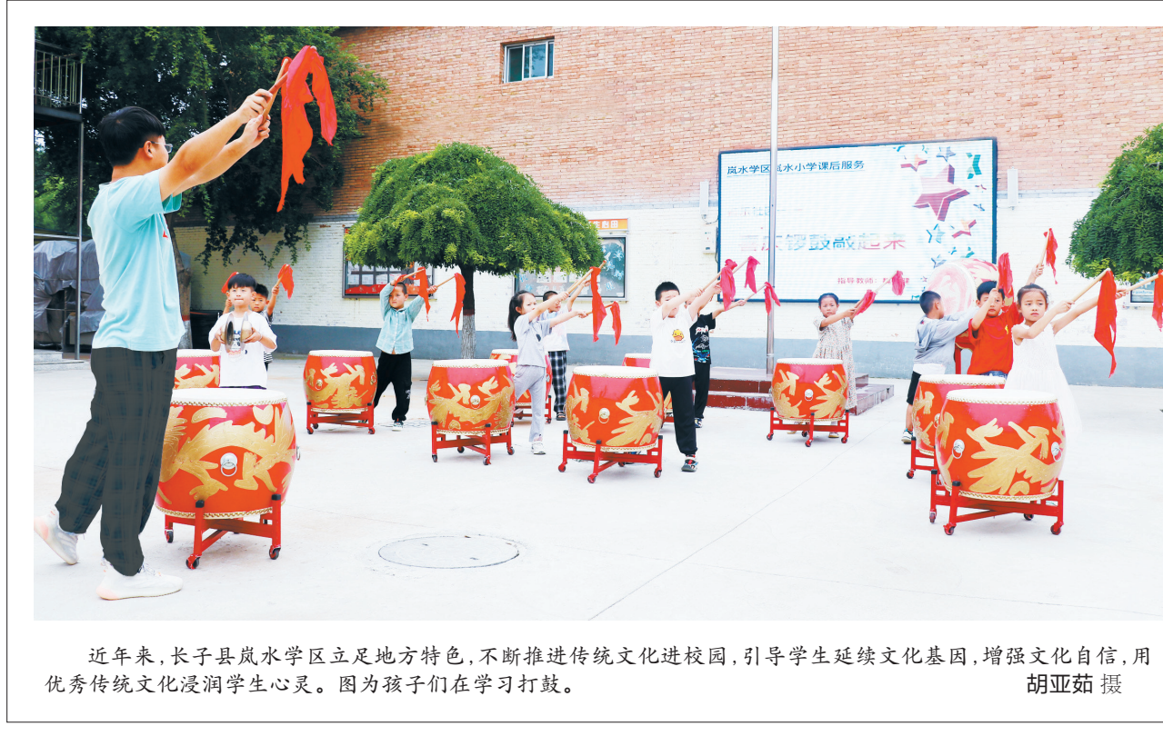
近年来,长子县岚水学区立足地方特色,不断推进传统文化进校园,引导学生延续文化基因,增强文化自信,用优秀传统文化浸润学生心灵。图为孩子们在学习打鼓。

“三角梅不仅花期长,而且花形漂亮,这些年销量一直很好,去年仅三角梅我们就售出6000多盆,销售额近20万元。”王永霞高兴地说,产销两旺的花卉产业得益