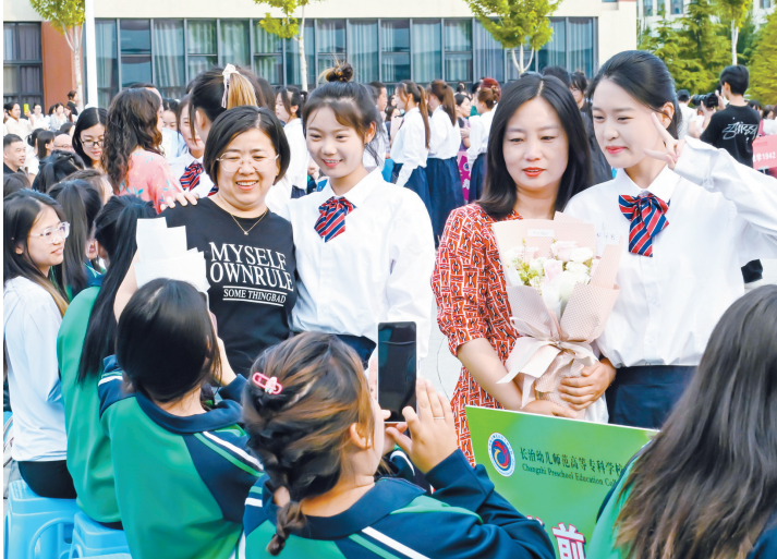
6月14日,长治幼儿师范高等专科学校举行2024届学生毕业典礼。来自学前教育、早期教育、音乐、中文教学和外语教学等8个系部的1100余名学生顺利完成学业,告别母校,开启全新的人生旅程。

今后,该院将严格按照基地建设标准,积极履行基地职责,整合各类优质资源,发挥中医药在肿瘤预防、治疗、康复方面的优势,借助中国老年学和老年医学学会的学术研究平台,开展肿瘤康复新理论、新技术的研究,引领和带动本地区肿瘤康复事业的发展,提升肿瘤患者全程生命质量,为肿瘤康复医学的繁荣和发展作出贡献。