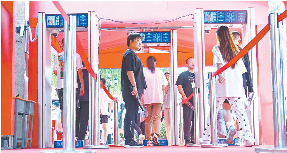
6月20日上午,2024年长治中考正式拉开序幕。全市34006名初三考生怀揣梦想,奔赴考场,全力以赴书写青春答卷。

力度,保障中考期间食品安全。气象部门加密监测频次,密切关注中考期间天气变化,及时为考生、家长提供最新的天气预报信息和全面的气象服务。社会各界也纷纷行动起来。“这是中考文具套装,有需要可免费领取。”“天气热,家长们可以喝点绿豆汤解暑……”在长治六中考点周边,志愿者们早早搭建起了服务站点,为考生及家长免费提供绿豆汤、矿泉水、考试用品、防暑降温应急药品等,用心护航、用爱助力。无数个日夜的努力,将汇聚成光、点亮未来的路。愿奔赴考场的每一位考生,无惧挑战,沉着应对,执笔为剑,共赴未来。