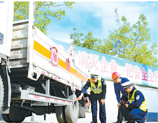
连日来,市公安局交警支队三大队紧盯“两客一危一货”等重点车辆及企业,持续开展专项整治行动,全力预防和减少道路交通事故发生。

本报讯 日前,沁县总工会、沁县精神文明创建服务中心联合主办的“劳动者日记”短视频征集大赛评选活动落下帷幕,并举行颁奖大会。此次活动旨在大力弘扬劳模精神、劳动精神和工匠精神,充分展示沁县广大劳动者的劳动风采,展现广大职工在劳动中创造快乐、体验幸福的工作场景。此次参赛作品内容丰富,有一线工作的网格员,有记录医务人员平时的工作实况,有幼儿教师辛苦工作的一天等,大家坚守在各行各业平凡的工作岗位上默默奉献,让人们切实感受到了广大劳动者身上满满的正能量。参赛作品充分展现了广大基层干部群众立足本职岗位,服务全县高质量发展的生动实践。参选的13个作品经过线上投票环节和评委现场打分,分别评出了一、二、三等奖和优秀组织奖。县人民医院工会选送的作品获一等奖,县红康幼儿园和英杰幼儿园获二等奖,胜利小学、郭村镇和册村镇获三等奖。(李晓)