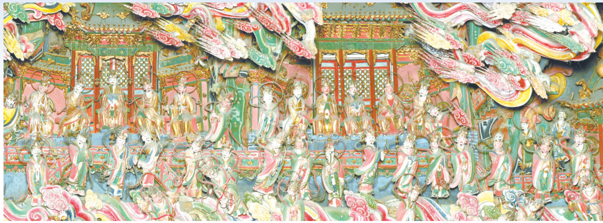
观音堂悬塑精美绝伦撼人心魄

字化信息采集工作，同时进一步研究扩大文物数字化成果的运用场景，利用网站、公众号等平台打造“古建筑云博物馆”，实现线上平台流量与线下文物资源开发利用的良性互动。