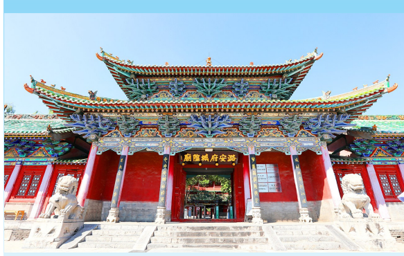
集元明清古建于一体的潞安府城隍庙

护与城乡建设发展相得益彰，古建丰姿，新韵迭出，一个个动人的故事正书写着新的城市记忆。