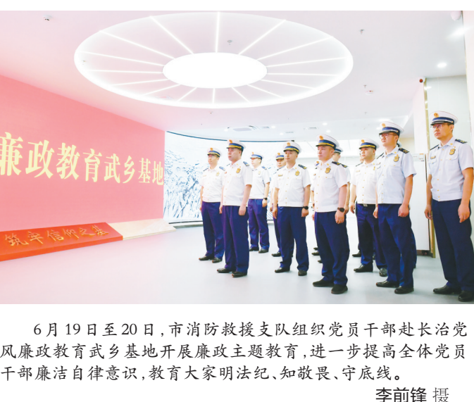
6月19日至20日,市消防救援支队组织党员干部赴长治党风廉政建设教育基地开展廉政主题教育,进一步提高全体党员干部廉洁自律意识,教育大家明法纪、知敬畏、守底线。

本报讯 记者常珍珍报道:6月22日上午,黎城县红十字会联合中华志愿者协会应急委长治服务队走进国网黎城县供电公司,开展以“生命教育‘救’在身边”为主题的应急救护培训活动。 此次培训旨在进一步普及应急救护知识,增强电力行业从业人员的急救意识,提高应急避险和自救互救能力。授课以“人人讲安全、个个会应急——畅通生命通道”为培训目标,结合日常工作中的大量案例和生活中可能出现的突发情况,采取“理论+实操”方式,围绕心肺复苏术、应急包扎方法、现场创伤救护等内容,为学员们进行详细的理论讲解和示范操作培训。培训中,参训学员认真学、用心记,积极参加实操练习,确保每个动作要领完全掌握;培训老师一对一、手把手指导,确保大家熟练掌握应急救护知识和技能。培训老师深入浅出地知识讲解、熟练高效的现场演示得到参训学员的一致好评。 培训结束后,参训学员进行了理论考试和实操考核。通过培训,企业员工提升了安全防范意识、应对突发事件的应急处置能力,为企业安全生产保驾护航。