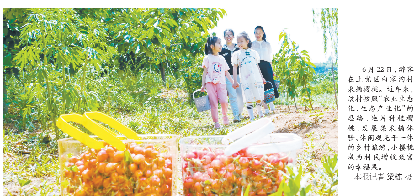
6月22日,游客在上党区白家沟村采摘樱桃。近年来,该村按照“农业生态化、生态产业化”的思路,连片种植樱桃,发展集采摘体验、休闲观光于一体的乡村旅游,小樱桃成为村民增收致富的幸福果。

此次公益性讲座让考生及家长对高考志愿填报有了清晰准确的认识,有助于大家科学合理填报高考志愿。据悉,长治人才集团在《山西教育》杂志社还将于6月27日在市中举办山西省2024年全国普通高校招生志愿填报咨询会。届时,100多所高校的代表将齐聚一堂,为考生和家长提供面对面咨询和交流。