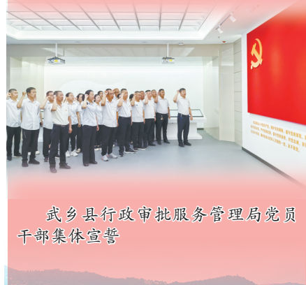
武乡县行政审批服务管理局党员干部集体宣誓