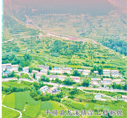
平顺县龙溪镇涂上新村新貌