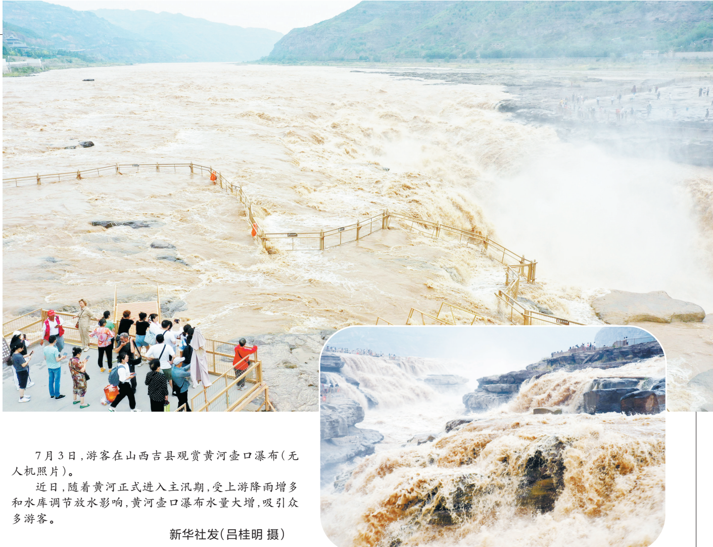
7月3日,游客在山西吉县观赏黄河壶口瀑布(无人机照片)。

据当地水文部门介绍,平时壶口瀑布水流量在700立方米/秒左右,近段时间黄河干流晋陕大峡谷水位上升,壶口瀑布水流量超过1100立方米/秒。