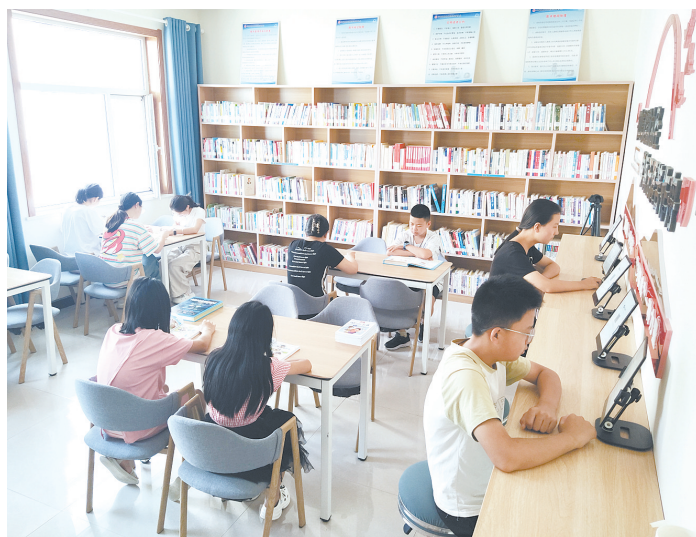
干净舒适的环境、门类齐全的图书、选择多样的阅读方式……进入暑期后,平顺县图书馆同兴苑服务点迎来读书热潮,不少学生和阅读爱好者来到这里畅游书海,尽享书香之夏。