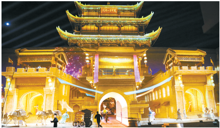
7 月 14 日晚在甘肃省嘉峪关市嘉峪关关城景区拍摄的夜游灯光剧《天下嘉峪关》光影效果。

7 月 15 日起, 被誉为“天下第一雄关”的嘉峪关正式开启“夜游”模式。夜游项目以嘉峪关关城原址为载体, 以长城文化、丝路文化为主题, 综合运用激光投影、数字科技、舞台实景演艺等形式, 带给游客全新的光影体验。