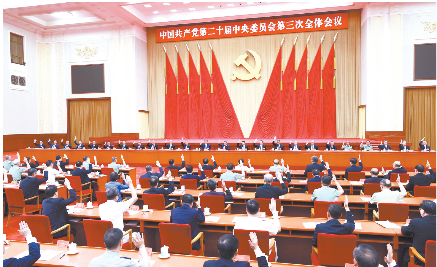
中国共产党第二十届中央委员会第三次全体会议,于2024年7月15日至18日在北京举行。中央政治局主持会议。