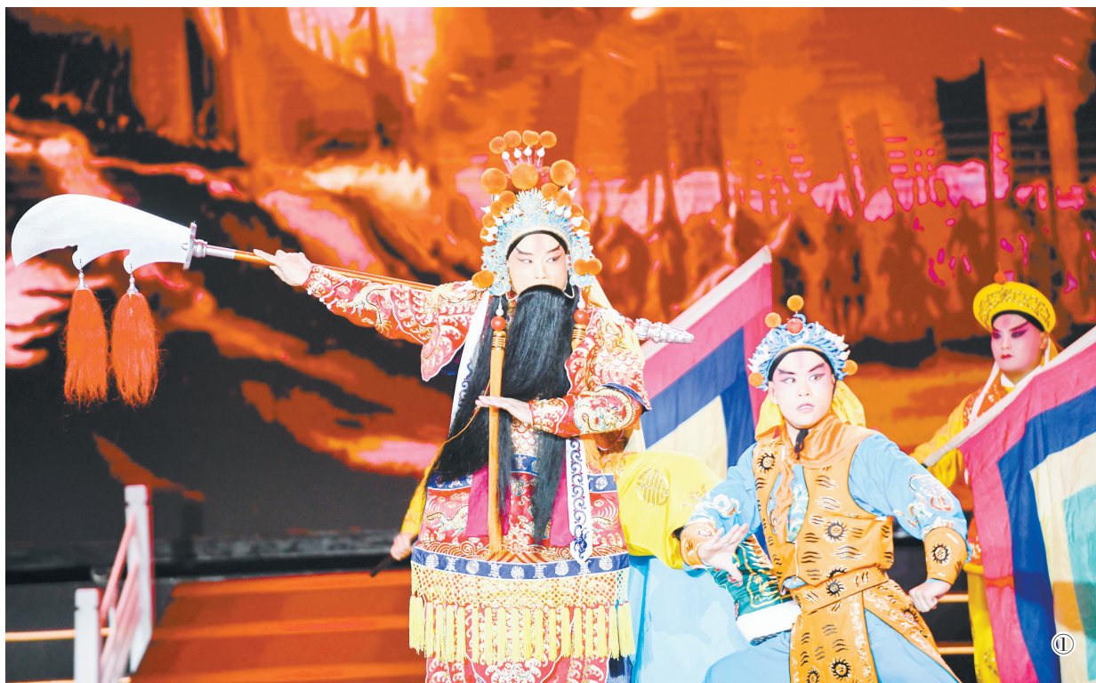
①丝弦《黄飞虎反五关》 ②上党落子《双锤子小将裴元庆》 ③晋剧《凤台关》

武戏之美亦是中华文化之美。悠扬戏韵萦绕耳畔，唱念做打尽显风采，名家荟萃的“武动梨园英雄会”凝聚武戏精气神，在新时代焕发无限生机和光彩。