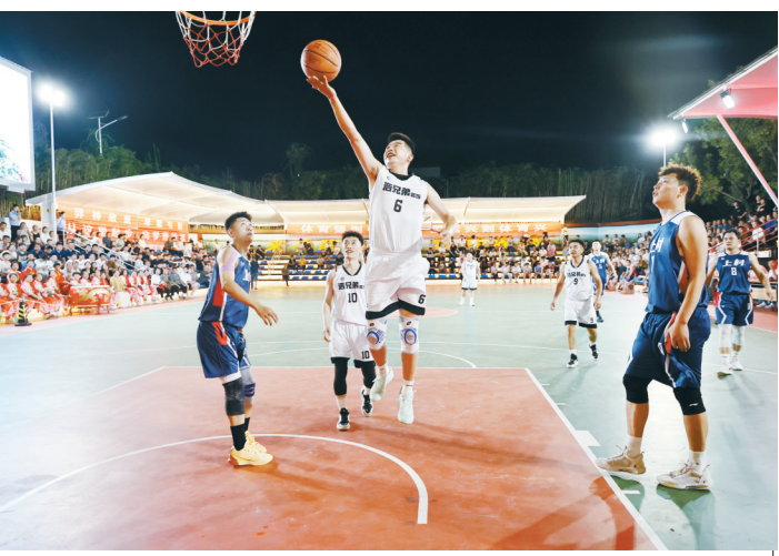
7月26日，2024年屯留区“巖体体育杯”第八届夏季篮球联赛暨“漳泽湖畔·悠然小南”村BA体育嘉年华比赛在小南村分赛场火热开赛，来自七个乡镇的篮球爱好者切磋球技，让大家感受到全民健身的魅力和活力。