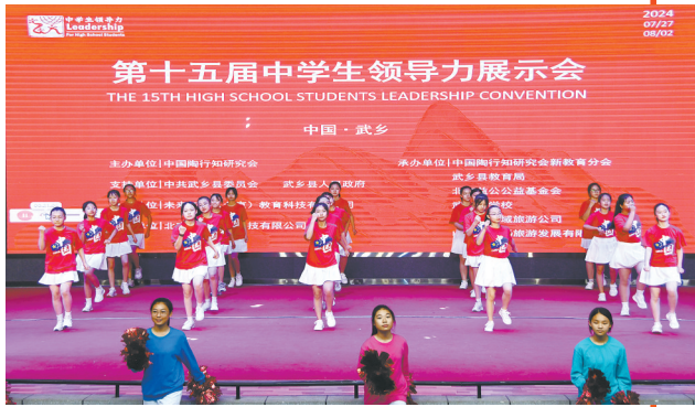
风帆满载 青春飞扬