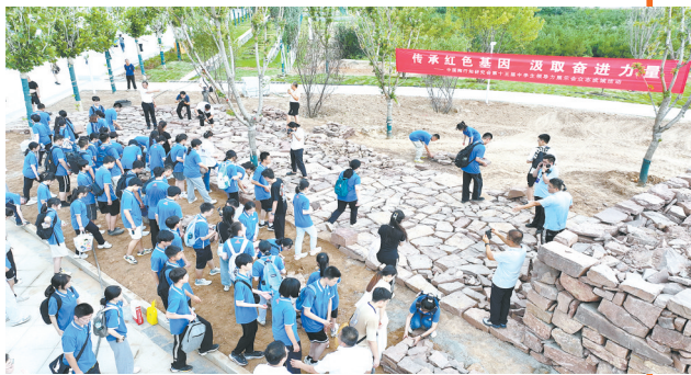
薪火相传 生生不息