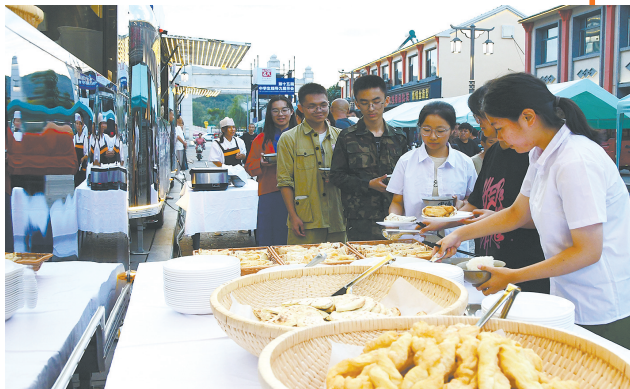
烟火人间 美食如诗