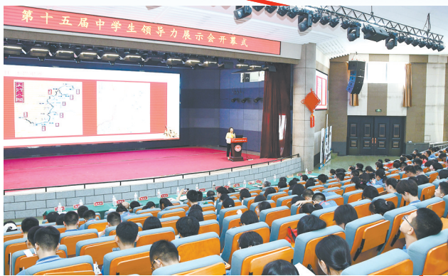
聆听讲座 笃行致远

台下12分钟,知题目、定心绪、理思路;台上12分钟,展思维、秀口才、论天下,明日之担当全在我青春。