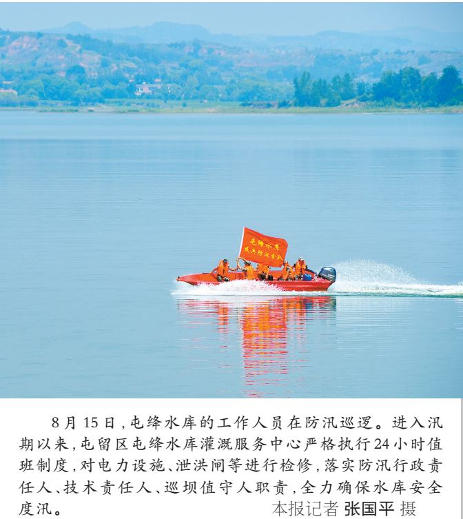
8月15日,屯绛水库的工作人员在防汛巡逻。进入汛期以来,屯留区屯绛水库灌溉服务中心严格执行24小时值班制度,对电力设施、泄洪闸等进行检修,落实防汛行政责任人、技术责任人、巡坝值守人职责,全力确保水库安全度汛。