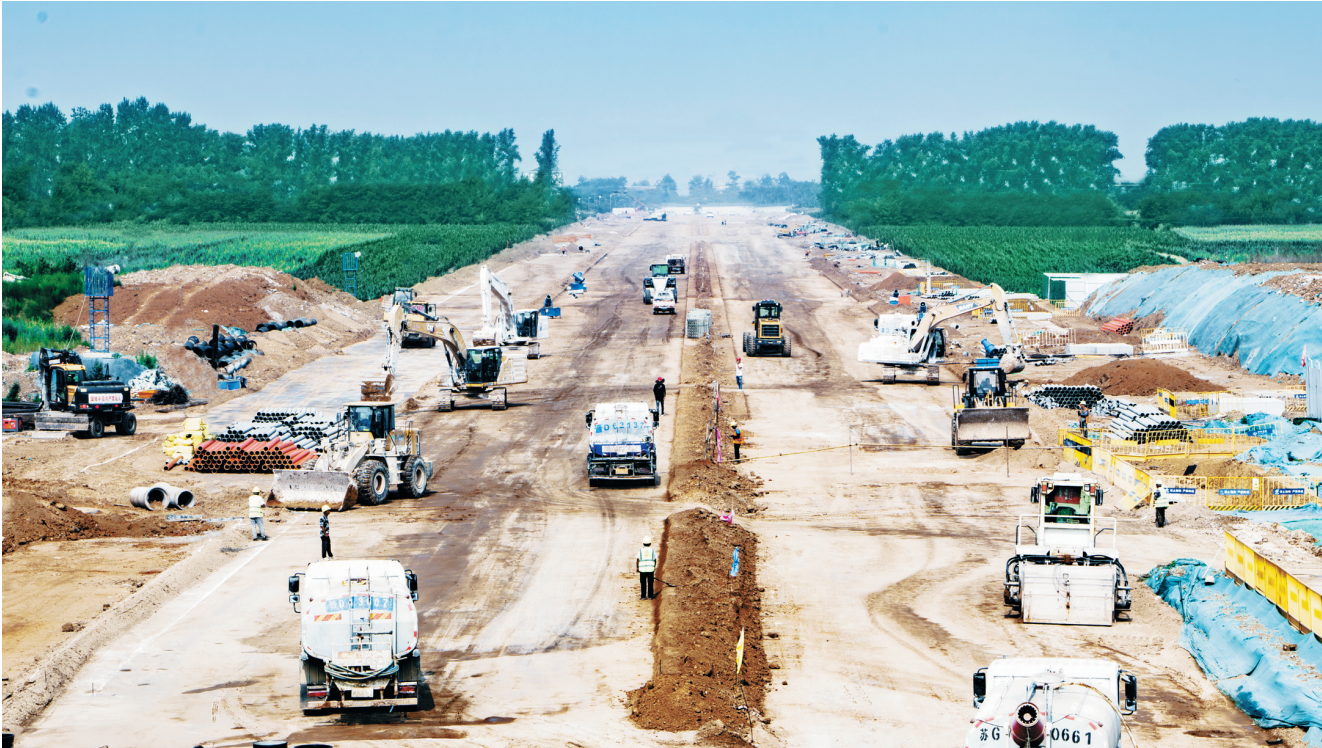
8月15日,长治高新大道(滨湖大道-威远门北路)施工现场,工人们正在加紧施工。该项目预计今年9月通车,竣工后将贯通滨湖片区与高铁片区,有效带动道路沿线区域的发展,对于进一步拓展城市框架、健全城市功能、提升城市品质具有显著成效。

与会同志纷纷表示,宣讲报告主题鲜明、内涵丰富、重点突出,对持续深入学习贯彻贯彻党的二十届三中全会精神具有重要指导意义。随后,史跃宏还深入金鼎钢铁集团煤焦化有限公司,面向企业负责人、技术人员和一线职工进行宣讲,就大家提出的促进绿色低碳发展、加强生态环境分区管控、提升生态环境质量等问题一一耐心解答,现场互动交流气氛热烈。他指出,企业要聚焦绿色低碳,增强主体责任意识,加大关键核心技术攻关力度,提升企业核心竞争力,推进产业智能化、绿色化、融合化,力争成为我省焦化行业标杆。