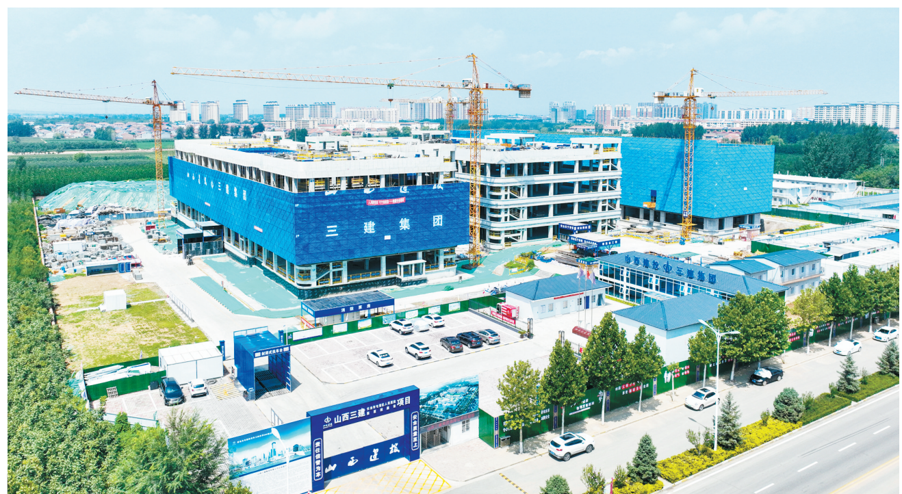
8月18日,屯留区人民医院新院建设项目施工现场,工人在抢抓工期拼进度。该项目建设内容包括新建门诊楼、医技楼、住院楼等设施,功能涵盖医疗、教学、科研、康复、急救等,预计2025年12月竣工。项目建成后,将进一步完善该区医疗卫生基础设施,提升医疗卫生服务水平、改善人民群众就医条件。李红卫 摄

会场内,与会人员聚精会神、认真聆听。大家纷纷表示,宣讲报告内容丰富、讲解透彻,既有深入浅出的理论阐释,又有联系实际的体会与思考,对深入学习领会、全面贯彻落实全会精神具有重要的教育和指导意义,将切实把思想统一到全会精神上来,锐意改革、真抓实干,全力推动长治经开区发展焕发新活力、迈上新台阶。