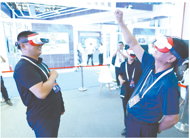
8月28日，观展者在2024中国国际大数据产业博览会会场体验VR设备。 当日，2024中国国际大数据产业博览会在贵阳市拉开帷幕，本届数博会以“数智共生：开创数字经济高质量发展新未来”为主题，将全方位、多角度展示国内外数据产业最新发展动态、最新成果和发展趋势。