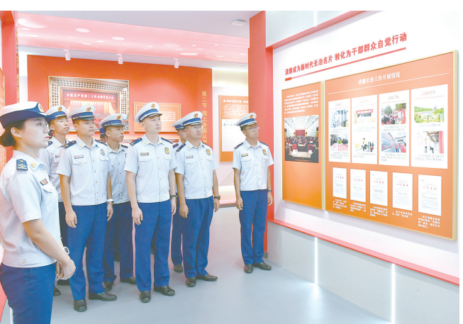
8月30日,市消防救援支队在武乡县开展2024年新晋党员教育主题党日活动,进一步提升新党员的党性修养,践行初心使命,增强做好新时代消防工作的责任感、使命感。

李敏强调,要按照全会关于科技创新的部署要求,围绕市委工作安排,在全面深化改革中持续提升对科技服务业重要性的认识,聚焦科技服务业高质量发展的重点难点,深入开展调查研究,形成更多高质量的调研成果,不断完善协商成果采纳、落实、反馈机制,为党政科学决策献智出力。就做好下一步政协工作,他要求,要围绕深入学习贯彻全会精神,做好政协工作,紧扣改革重大任务、重点领域、关键环节,充分发挥专门协商机构作用,深入协商议政,广泛凝聚共识,在高质量完成年度协商计划、深入开展民主监督、发挥统一战线组织功能和“我为高质量发展作贡献”等工作中见实效,确保全年目标任务按时序进度、高质高效完成,以优异成绩迎接中华人民共和国成立75周年、人民政协成立75周年。