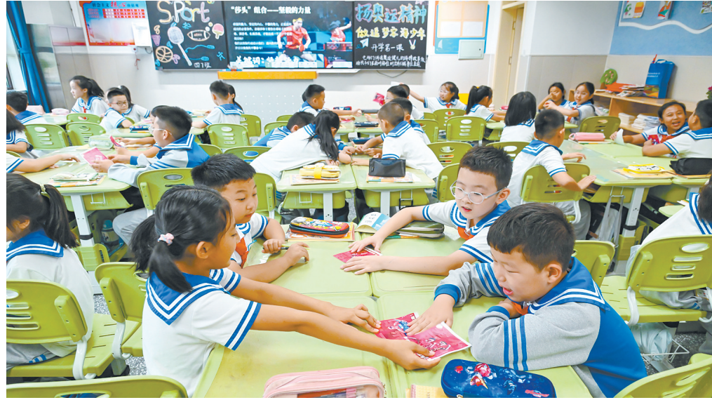
乡村行 看振兴 一线纪事

高水平社会主义市场经济体制是中国式现代化的重要保障。深化经济体制改革,精准发力、同向用力,处理好经济和社会、政府和市场、效率和公平、活力和秩序、发展和安全等重大关系,山西必然会进一步解放和发展社会生产力,加速形成新质生产力,激活经济社会发展的活力和动力。