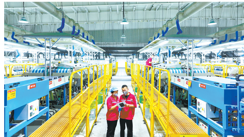
9月18日，长治高测新材料有限公司生产车间内，工人们专注工作。近年来，我市一大批高新企业茁壮成长，集群发展，为促进经济高质量发展注入强劲动能。

在沁县曲艺协会，李敏走访看望市政协委员、沁州三弦书非遗省级传承人李彩英，(下转第二版)