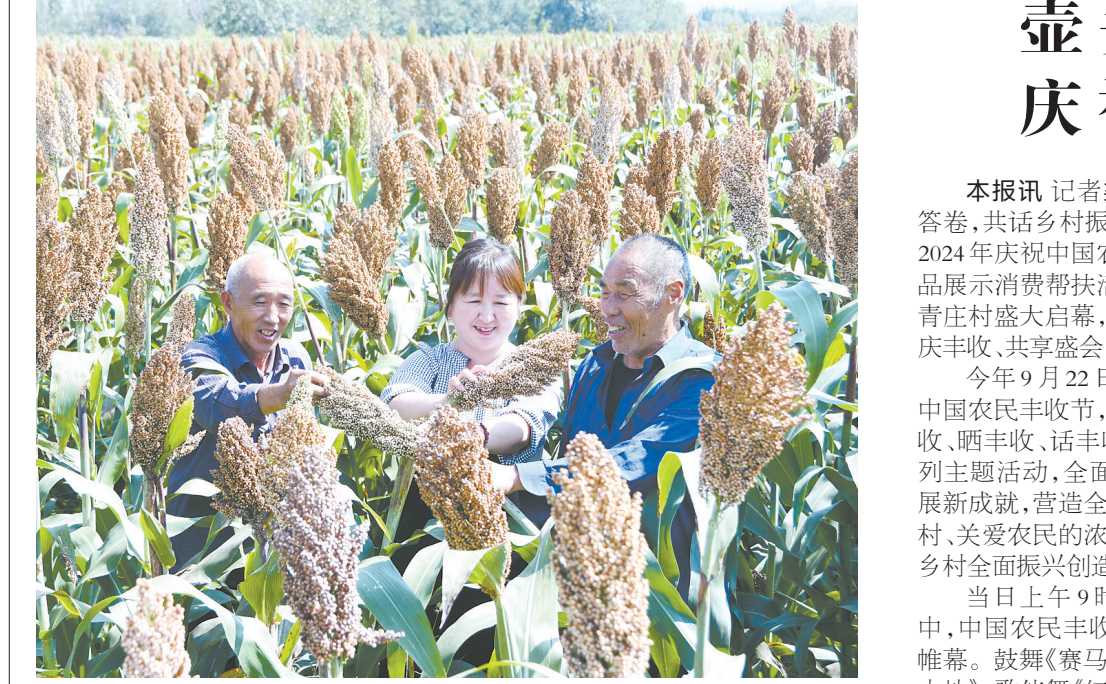
9月22日，黎城县洪井镇北社村的田野里，村民们看着沉甸甸的高粱穗喜笑颜开。第七届中国农民丰收节到来，我市各县区五谷丰登、瓜果飘香，农民群众满心欢喜地晒特产、展民俗，礼赞丰收，共话美好生活。

秋分时节，五谷丰登，瓜果飘香，共庆丰年。一年一度的中国农民丰收节如约而至，广袤的中华大地上处处洋溢着丰收的喜悦与自豪。这个节日，是对农民辛勤耕耘的礼赞，是对大地丰厚馈赠的感恩，更是对乡村振兴战略的生动诠释。