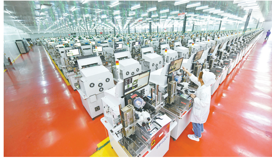
高科华兴有机发光二极管封装项目车间有序作业