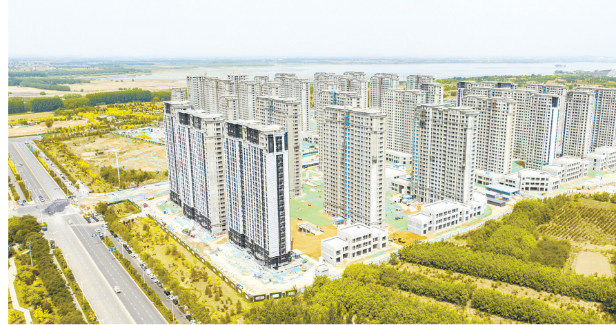
小常片区城改项目全速推进