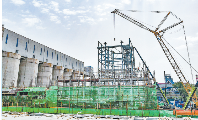
首钢长钢富余煤气双超发电项目技术追新、发展逐绿