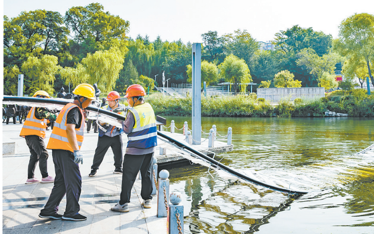
“三河一渠”水质提升综合治理保质保量