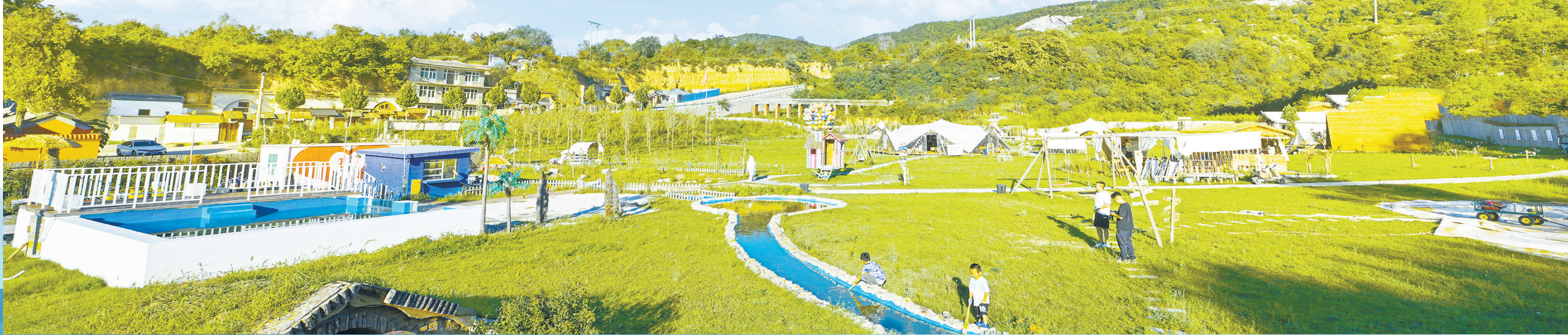
来秋谷里民宿享自然之美