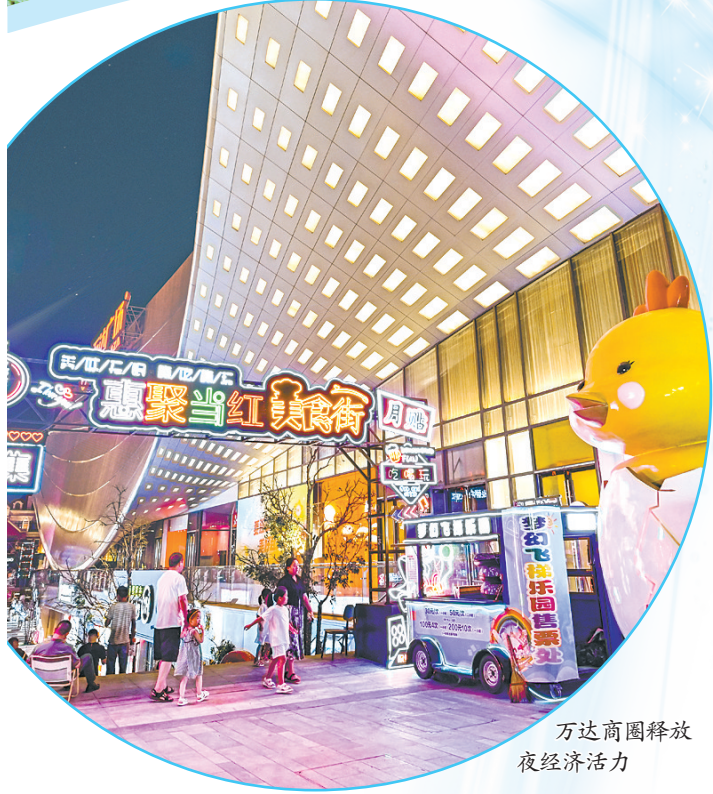
万达商圈释放夜经济活力

暑热消退，秋高气爽，正是施工黄金期。连日来，潞州区各项目施工现场，建设者们抢抓时机、紧扣节点、抢工期、赶进度，开足马力、并驾齐驱，项目建设拉满“进度条”，跑出“加速度”。今年以来，潞州区按照市委“项目建设年”部署，紧紧抓住项目建设这个“牛鼻子”，持续改造提升传统产业，培育壮大新兴产业，提质提效现代服务业，力争以最快的速度推进有效投资落地，拉动经济增长，为高质量发展提供有力支撑。今年全区共谋划实施项目408个，总投资1548.78亿元。