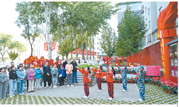
9月23日,潞州区上南街小学红色文化园,小小红色讲解员在给家长们讲长征支队的红色故事,进一步弘扬红色传统、追寻红色记忆、传承红色基因。

此次培训班由市文化和旅游局主办,市文旅发展中心承办,旨在让导游们更好地了解长治丰富的古建筑文化资源,提高讲解水平和服务质量,为游客提供更加专业、生动的旅游体验。培训过程中,老师们通过生动的图片、详实的案例,系统地介绍了长治古建筑的历史渊源、建筑风格、文化内涵等方面的知识,并深入原起寺、大云院、天台庵、龙门寺等古建现场教学示范,上了一堂精彩的古建课。参与培训的导游们认真听讲、积极互动。大家纷纷表示,将以此次古建专题培训为契机,增强对长治古建的认识和理解,创新讲解技巧和方法,提升业务素质和道德素养,增加古建讲解趣味性和艺术性,为传播好长治优秀传统文化、推动全市文化旅游产业高质量发展贡献力量。