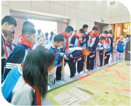
红色基因润心灵，研学实践助成长。