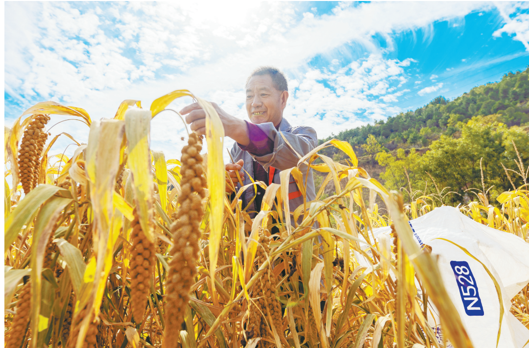
10月4日，平顺县西沟乡南寨村田间地头满目金黄，村民正利用晴好天气收割成熟的谷子，确保颗粒归仓。近年来，该村积极引导村民因地制宜发展特色产业，让一株株沉甸甸的谷穗，铺满了广大村民的增收致富路。

在潞城区，一个个“西流北村”正高举党建旗帜，用勤劳与智慧，共绘一幅乡村振兴斑斓画卷。