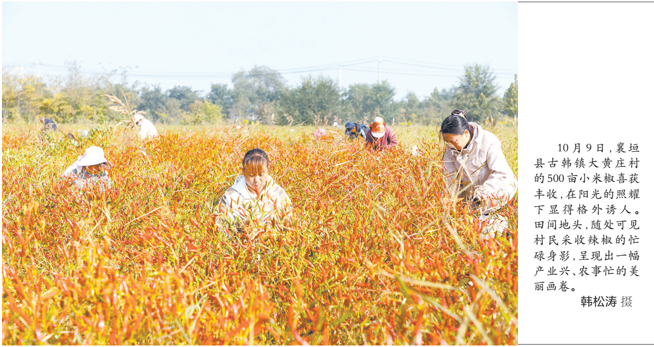
10月9日，襄垣县古韩镇大庄村500亩小米椒喜获丰收，在阳光的照耀下显得格外诱人。田间地头，随处可见村民采收辣椒的忙碌身影，呈现出一幅产业兴、农事忙的美丽画卷。