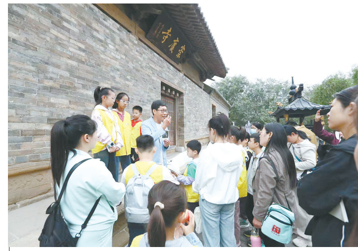
10月6日，学生们在长子县崇庆寺参加古建研学活动。近年来，长子县依托深厚的文物价值优势，通过“文物+研学”，全力打造古建彩塑研学产业。

随着秋收时节的来到，田间地头因地界划分、农机租赁、劳资纠纷、邻里纠纷产生的矛盾也随之增多。为了做到涉农纠纷情快到场、快处置、快调解，民辅警主动走进田间地头，在与群众农忙闲谈中，主动摸排可能存在的小矛盾、小纠纷，巧妙化解田间“烦心事”。“大家种地挣钱不容易，可不能上当受骗……”基层派出所民辅警与乡亲们拉家常、话法律，讲解秋收时节防范电信网络诈骗、落实生产安全等知识，提醒大家在农忙时切勿放松警惕。同时，民辅警还利用“农村大喇叭”、微信群进行安全宣传，多措并举提高群众安全防范意识。(白宝良)