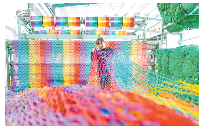
10月8日，在山东省滨州市丹林体育用品用品有限公司，工作人员加工绳网产品。近年来，该县发展绳网产业，助推乡村振兴。目前，形成了集原材料供应、研发设计、成品加工、市场销售、应用服务等于一体的产业集群。