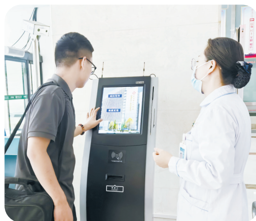
↑为患者家属讲解如何操作智能医技预约系统。